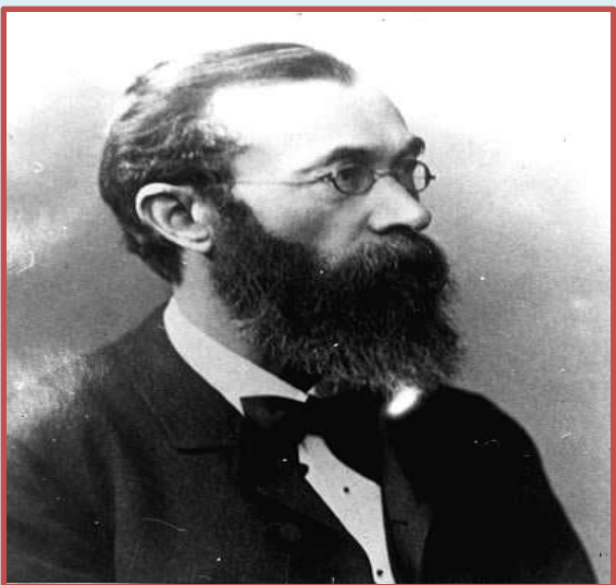
Вильгельм Вундт (1832-1920)

1921 ж. өзінің "Тән құрылысы және мінез" атты белгілі еңбегінде темперамент адамның тән құрылысының белгілі психикалық ерекшеліктерімен байланысты деген пікір білдірді.