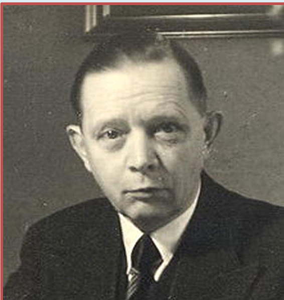
Эрнст Кречмер (1888-1964)

1921 ж. өзінің "Тән құрылысы және мінез" атты белгілі еңбегінде темперамент адамның тән құрылысының белгілі психикалық ерекшеліктерімен байланысты деген пікір білдірді.