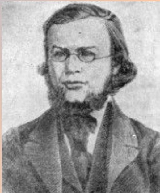
К.К. Сент-Илер (1834-19