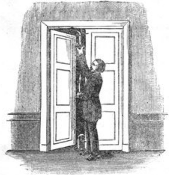
Рис. 49. Движение воздуха в дверях.

Земля нагревается солнцем, но солнце не всюду греет одинаково. Есть страны, где солнце круглый год греет словно летом, но есть и такие страны, где оно не показывается по целым месяцам. От неравномерного нагревания земли солнцем и бывают ветры.