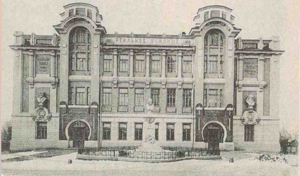
Г. Владиміръ. Реальное Училище.