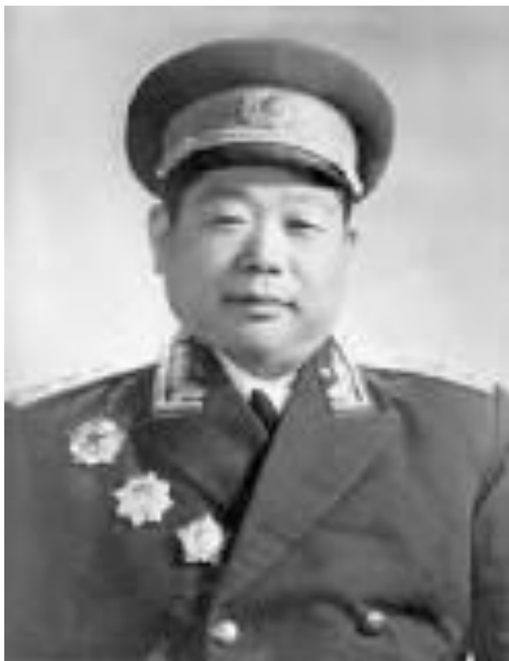
Чэнь Силян, командующий пекинским военным округом генерал