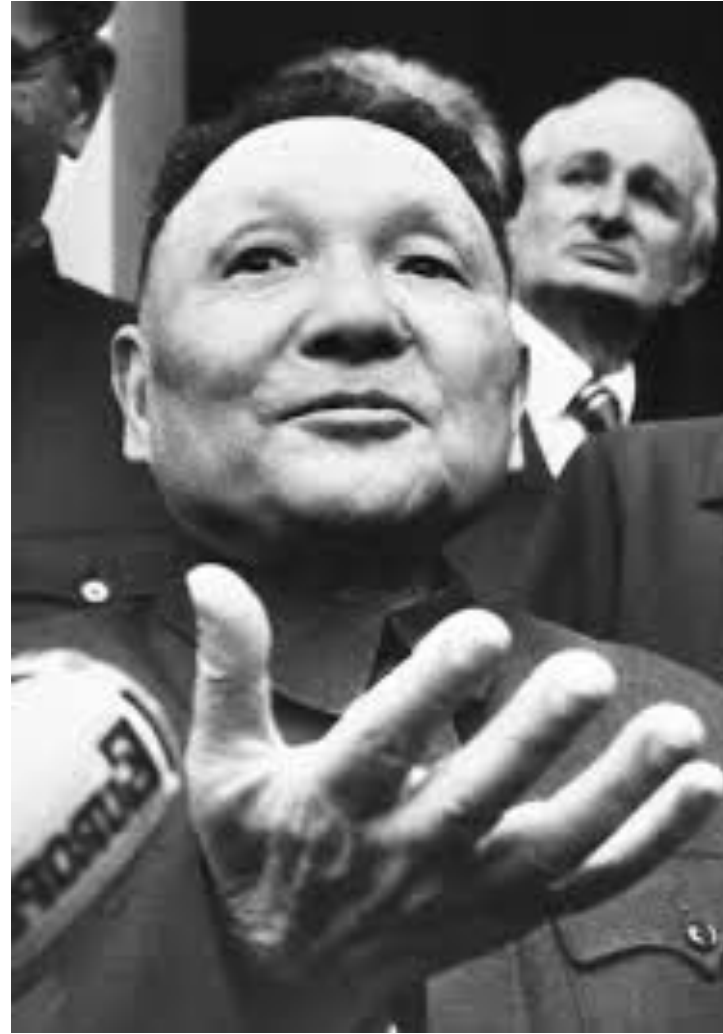
Дэн Сяопин, фактическим руководителем Китая с конца 1970-х до начала 1990-х гг.