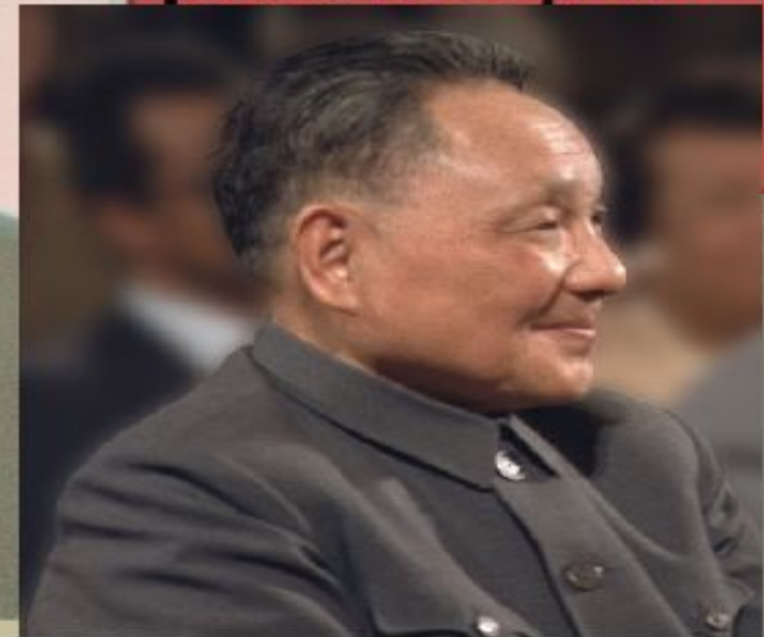
Мао Цзэдун (1893-1976)