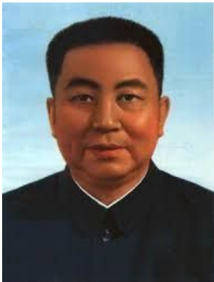
• Хуа Гофэн, председатель ЦК КПК в период с 1976 по 1981