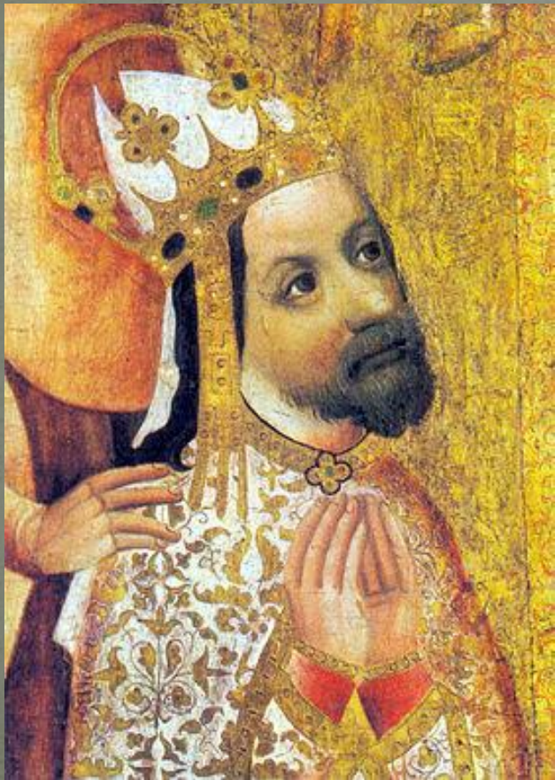
Карл IV (1347-1378)

Императоры Священной Римской империи, не имея сильной власти, пытались удержать влияние за счет расширения своих родовых владений.