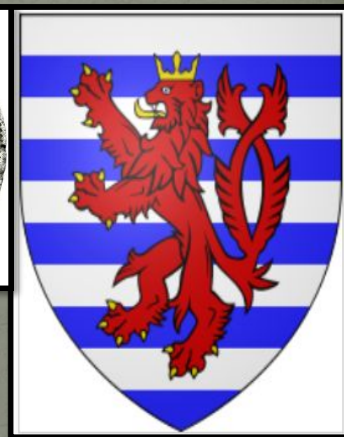
Герб династии Люксембургов