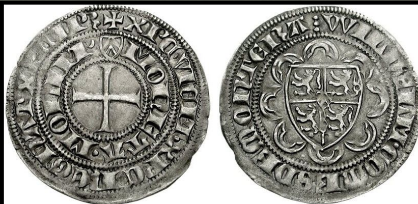
Широкий пфенниг. Герцогство Юлих-Берг. Германия, XIV век