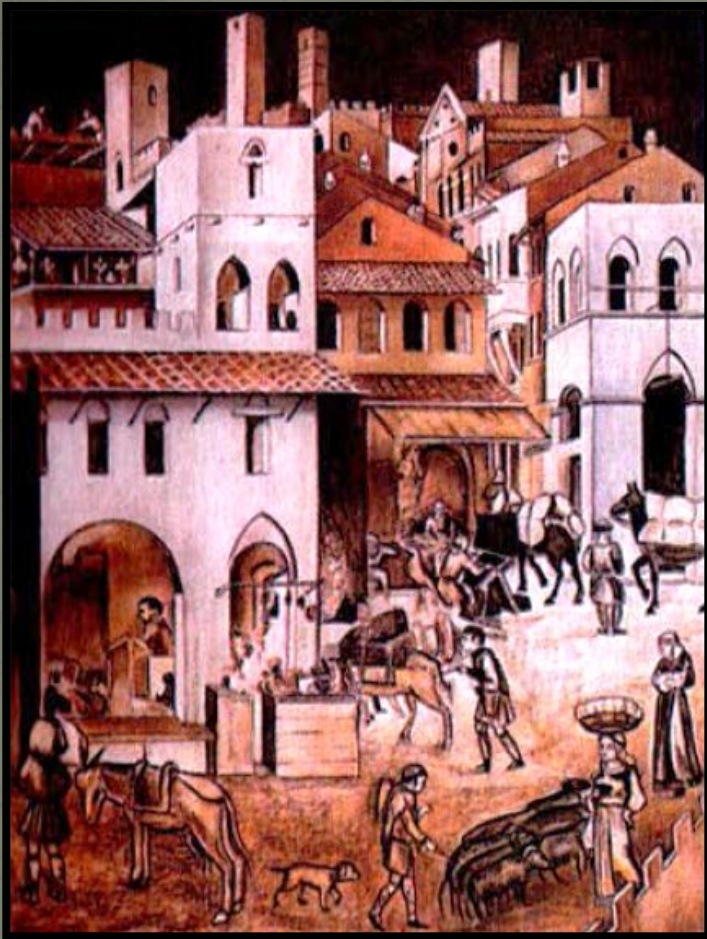
Улица в средневековой Сиене (Италия). XIV век

Богатые города Северной и Средней Италии – Милан, Флоренция, Пиза, Болонья, Генуя и другие – были городами - государствами или городскими республиками со своими органами управления.