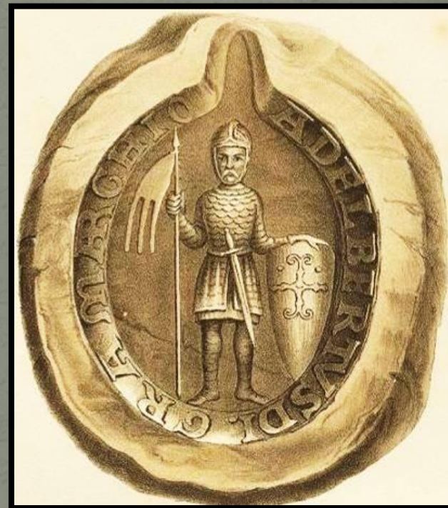
Печать Альбрехта Медведя

На месте славянского города Бранибор Альбрехт Медведь основал княжество Бранденбург. Позднее на его территории возник г. Берлин.