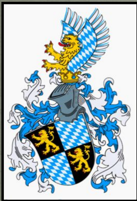
Герб династии Виттельсбахов, правивших в Баварии

В своих владениях немецкие герцоги и князья чеканили монету, собирали налоги и пошлины, судили людей, основывали города. Императоры Священной Римской империи вынуждены были считаться с властью немецких князей.