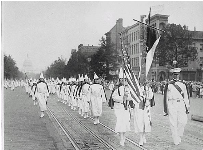
Парад ККК, 1928 год, Вашингтон

По прежнему продолжает деятельность, только в виде разрозненных групп