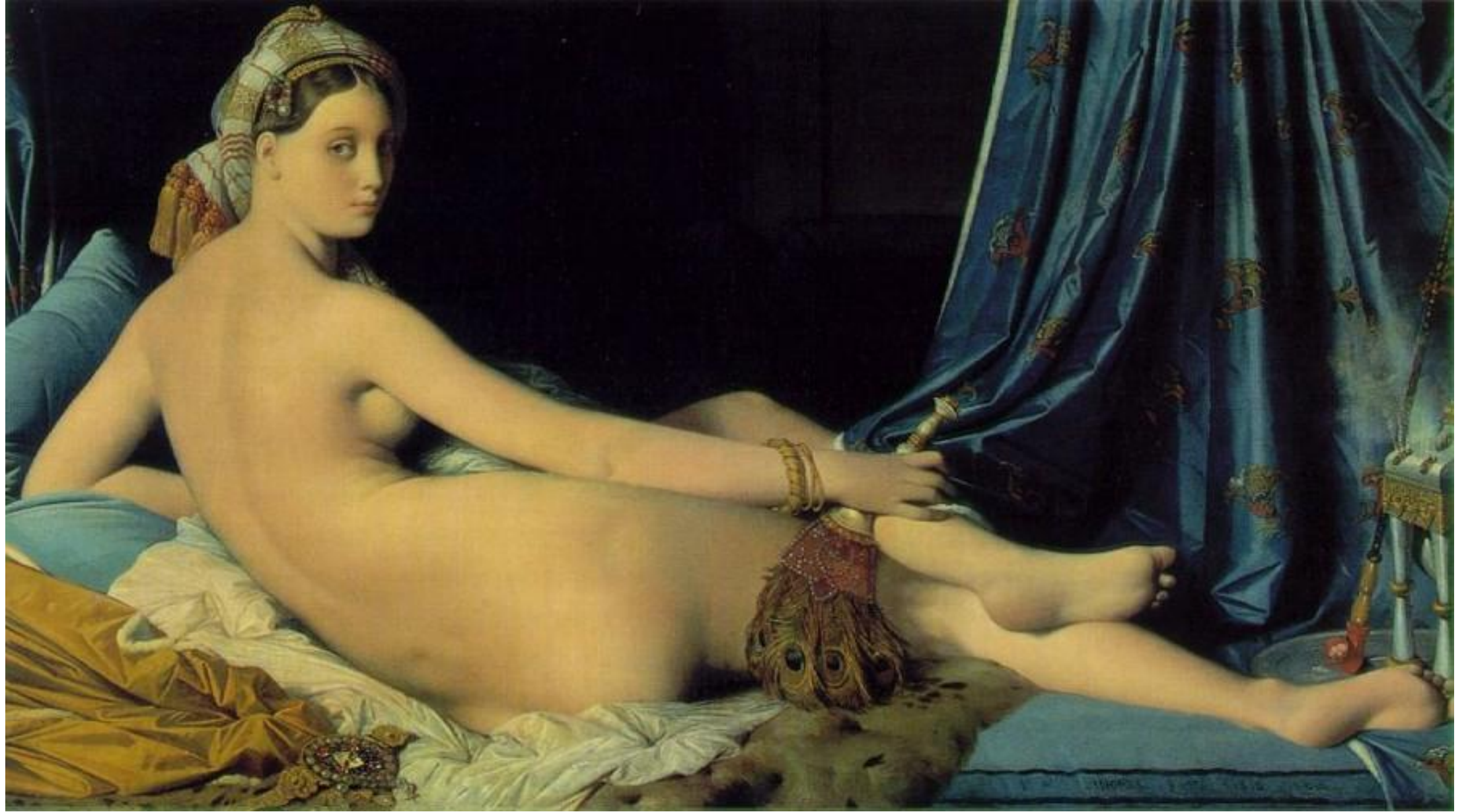
Большая одалиска 1814 Холст, масло. 91 x 162 Лувр, Париж