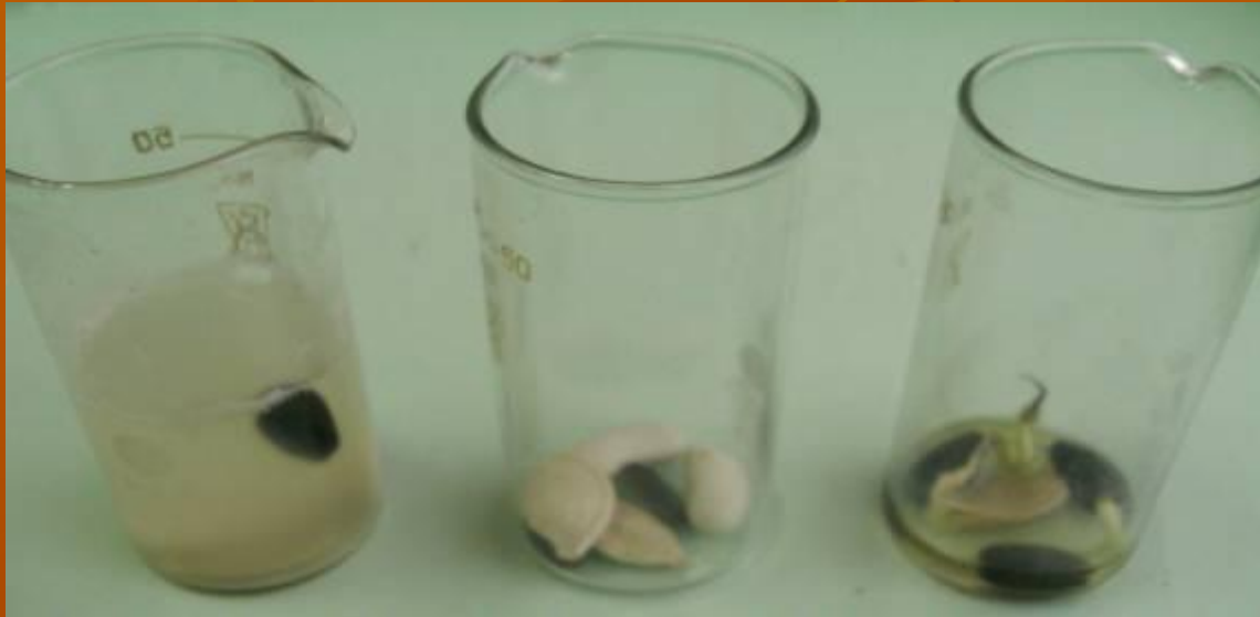
Семена погибли без доступа воздуха