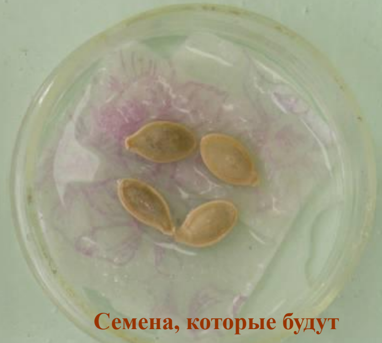
Семена, которые будут помещены в прохладные условия