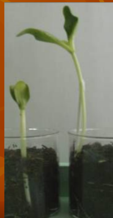
Спустя десять дней после закладки опыта