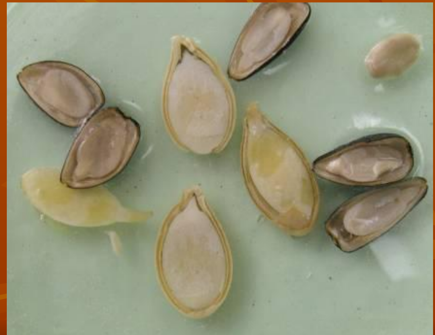
Семена с удаленной одной семядолей