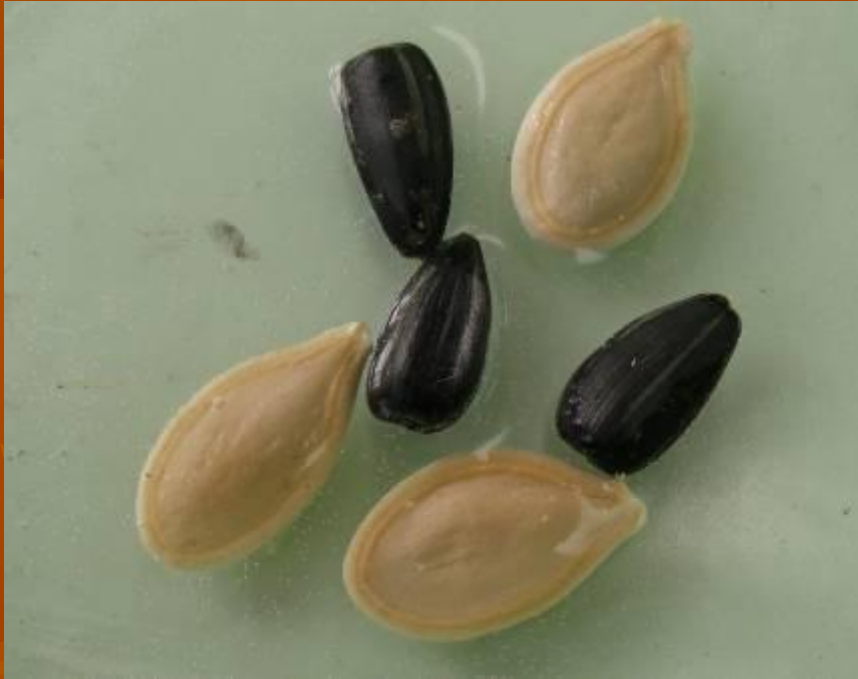
Полноценные семена с двумя семядолями