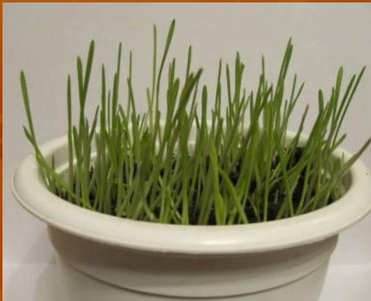
Семена овса, проращенные в темноте