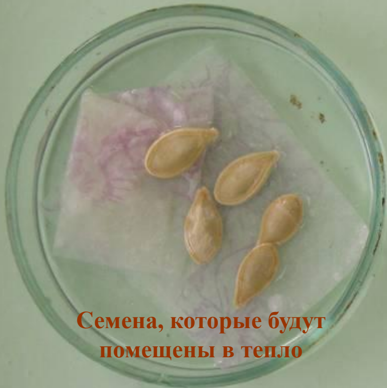
Семена, которые будут помещены в тепло