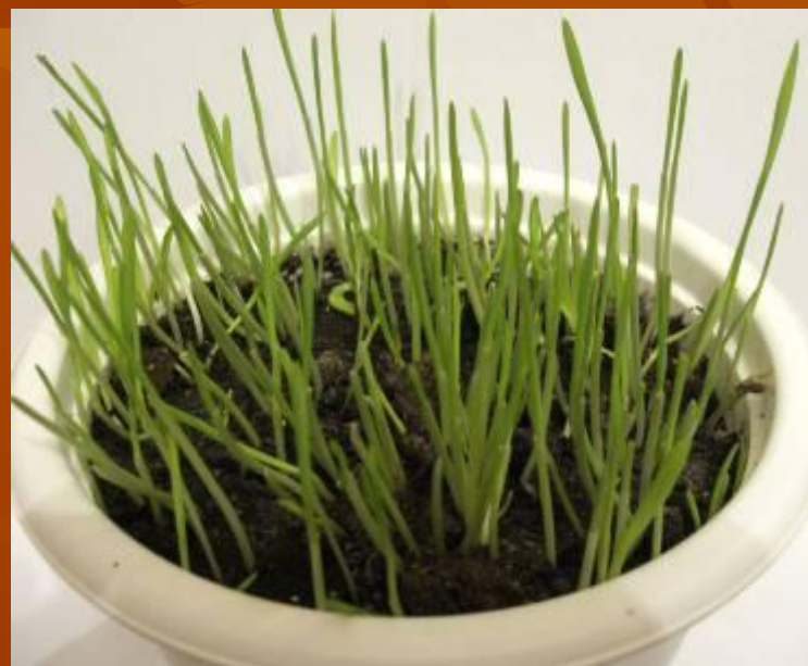
Семена овса, проращенные на свету