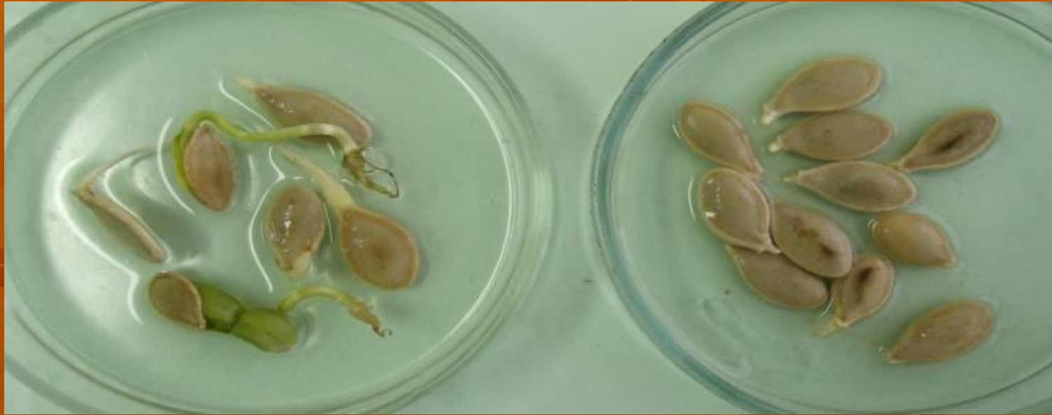
Семена, пророщенные в тепле