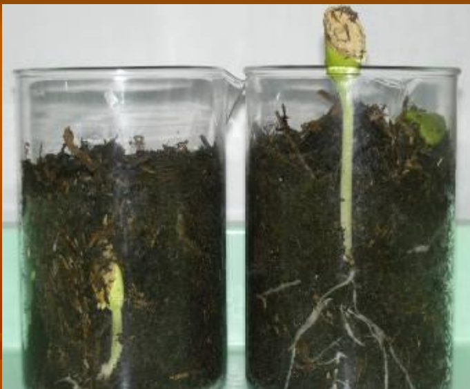
Спустя пять дней после закладки опыта

Проростки тыквы, появившиеся после посадки ее семян в почву на разную глубину