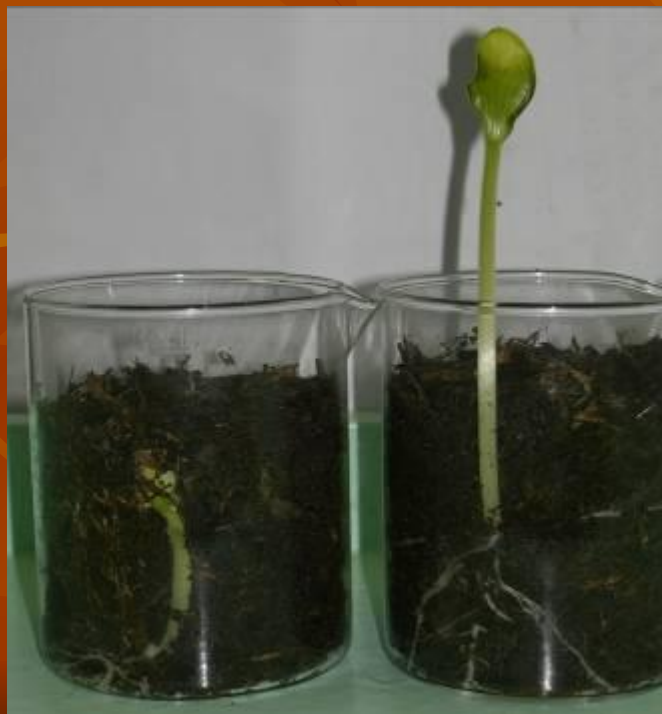
Спустя семь дней после закладки опыта

Проростки тыквы, появившиеся после посадки ее семян в почву на разную глубину