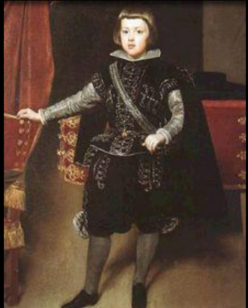
«Портрет Филиппа IV»