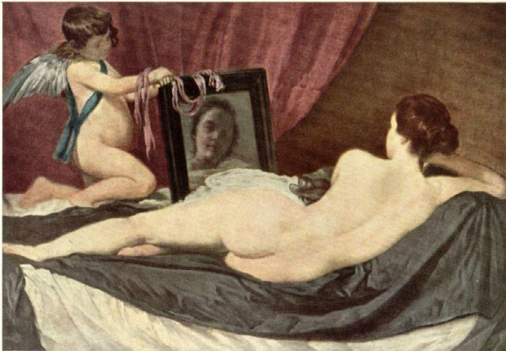
ВЕНЕРА С ЗЕРКАЛОМ

В Италии же (или вскоре после возвращения в Мадрид) художник исполняет композицию « Венера перед зеркалом ».