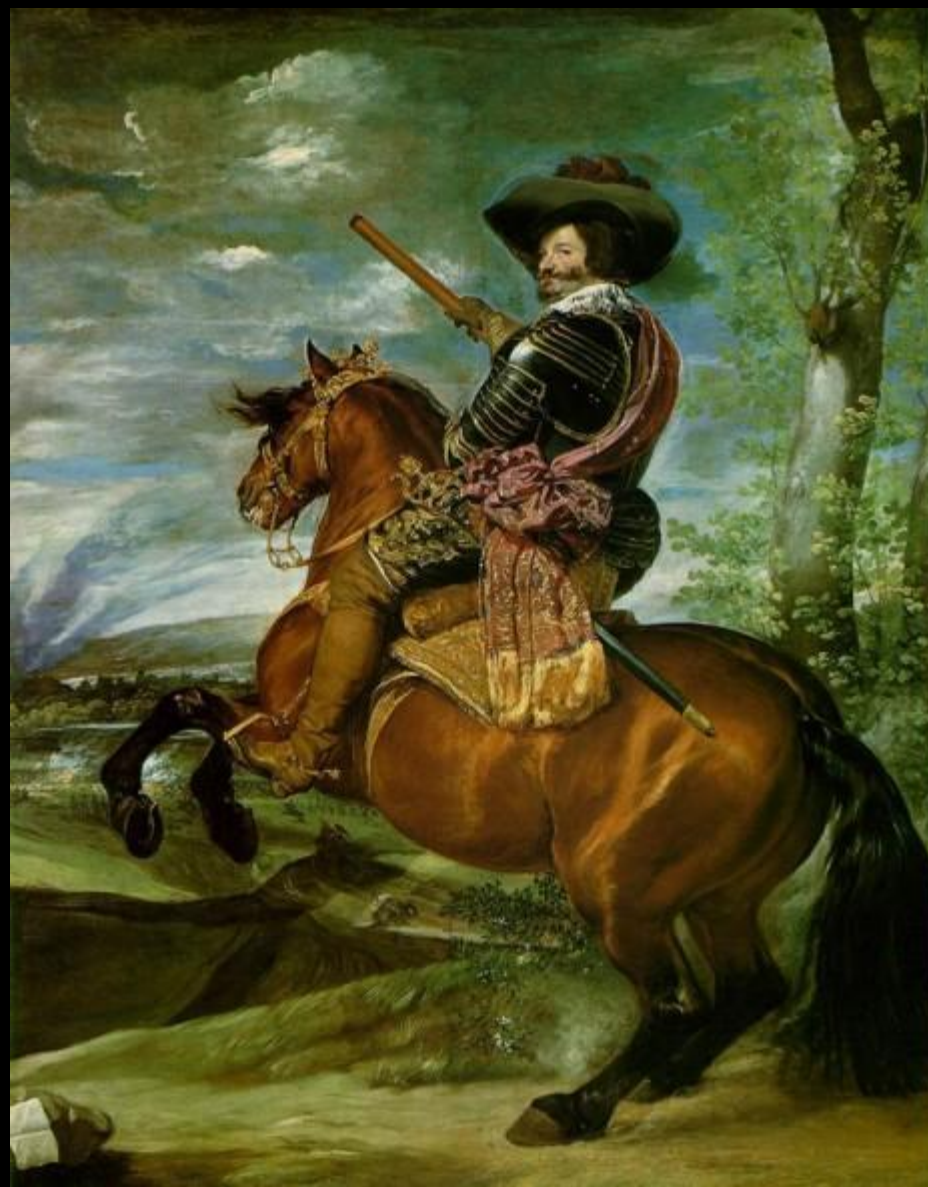
(« Конный портрет герцога Оливареса »,

В середине 1623 г. Веласкес переезжает в Мадрид и становится королевским живописцем. Он пишет портреты королевских особ и придворных; знакомится с королевской коллекцией живописи — картинами Рафаэля, Леонардо да Винчи, Тициана, Веронезе и других прославленных мастеров. В 1627 г. Веласкес стал победителем конкурса среди придворных живописцев, посвященного исторической теме «Изгнание морисков из Испании в 1609 г.». В качестве награды художник получил должность «хранителя королевской двери», занимать которую многие рыцари почитали за честь.