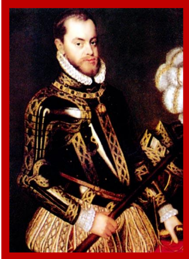
Филипп II – король Испании (1556-1598):

Генеральные штаты – представительный орган Нидерландов