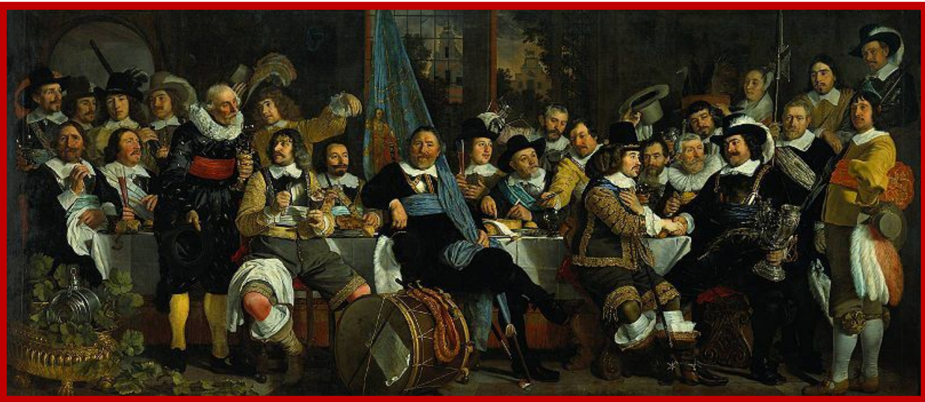
Жители Амстердама празднуют Мюнстерский мир (картина Б. ван дер Гельста)