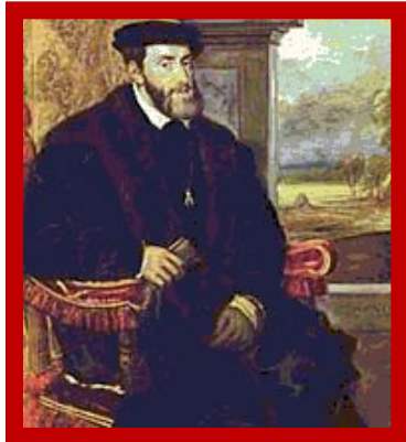
Карл V - император Священной Римской империи из династии Габсбургов (1519—1556) король Испании (1516-1556)