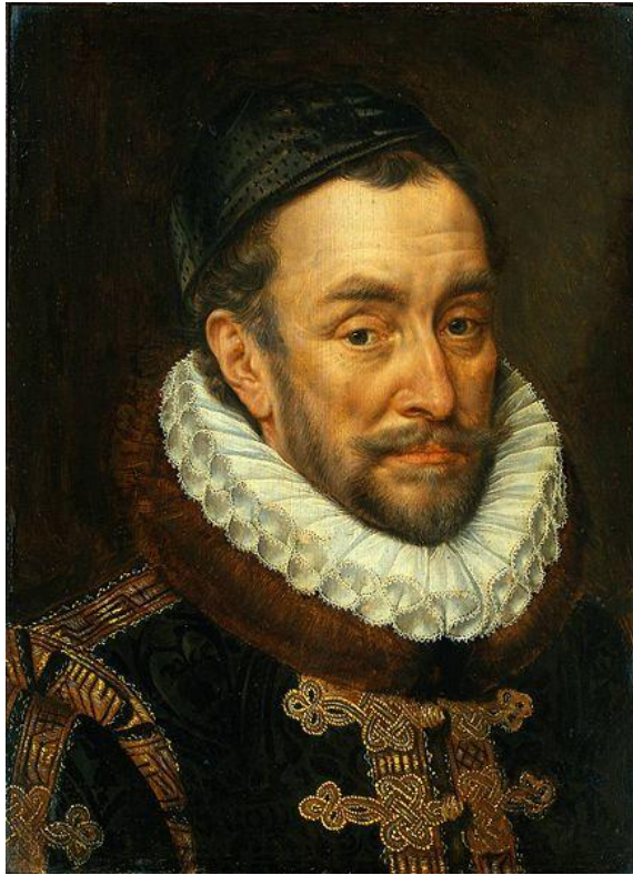
Вильгельм I Оранский – руководитель освободительного движения в Нидерландах

1572 год – восстание на севере Нидерландов.