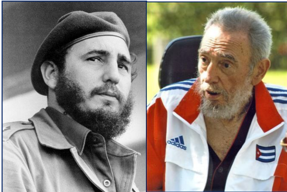
Ф.Кастро, лідер кубинської революції. 1959-2012 рр..

Перехід до соціалізму через збереження різних форм власності, багатопартійності, демократизацію