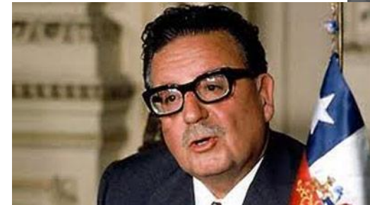
С.Альенде, президент Чилі 1970 - 1973рр.