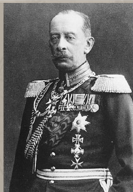
Выдающийся военный теоретик генерал Альфред фон Шлиффен

После объявления войны России 1 августа 1914 г. Германия предъявила Франции ультиматум, требуя от нее сохранения нейтралитета, однако Франция заявила, что исполнит свои союзнические обязательства перед Россией, и 3 августа Германия объявила ей войну под предлогом якобы имевшей место бомбардировки германской территории французскими аэропланами.