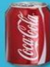
БАНКА ИЗ ПОД НАПИТКА