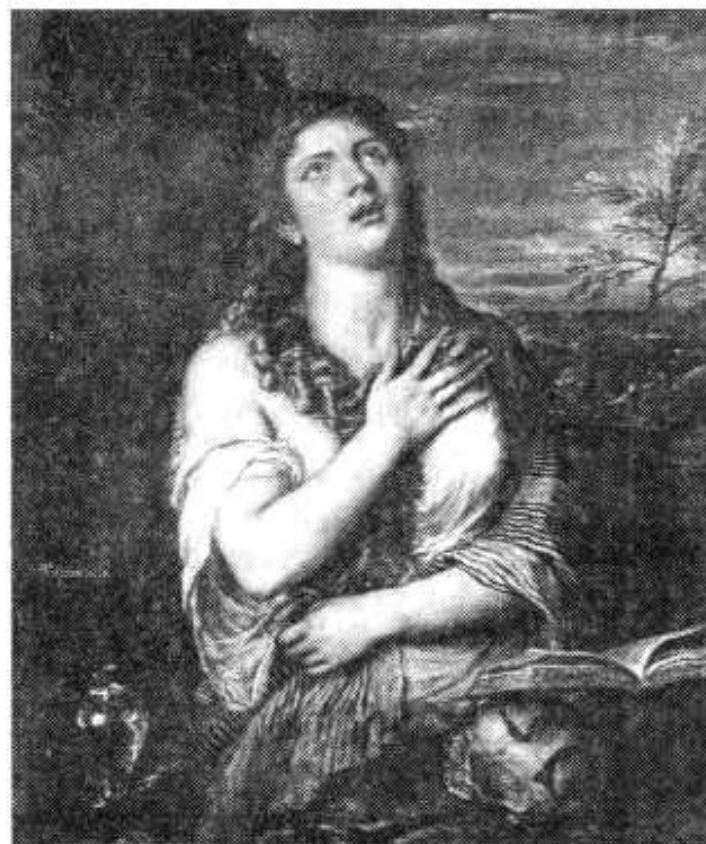
Рис. 8. Тициан. Кающаяся Мария Магдалена