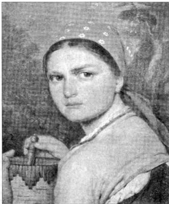
Рис. 5. А. Венецианов. Девушка с берестяным коробом