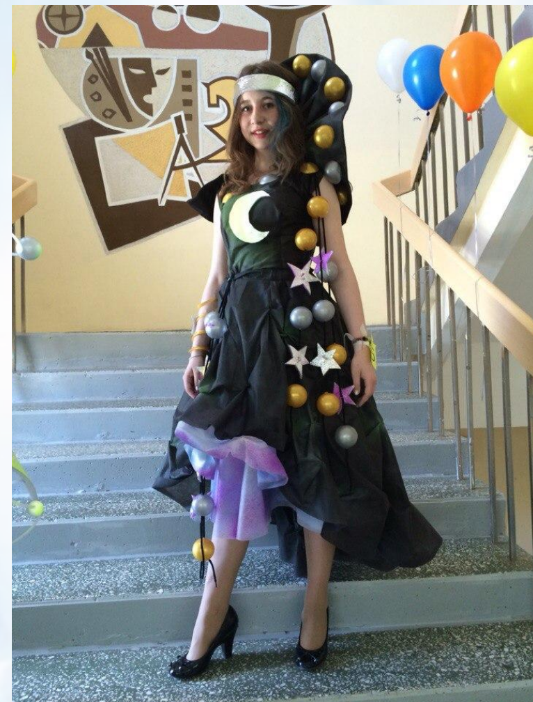
Костюм «Космос», выполненный в рамках Интерактивного фестиваля-конкурса «АРТ-ОЛИМП РОСАТОМА»