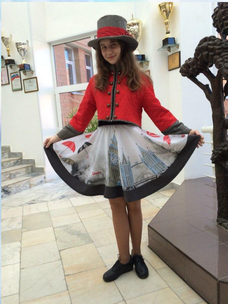
Костюм «Лондон» из коллекции «Города мира»