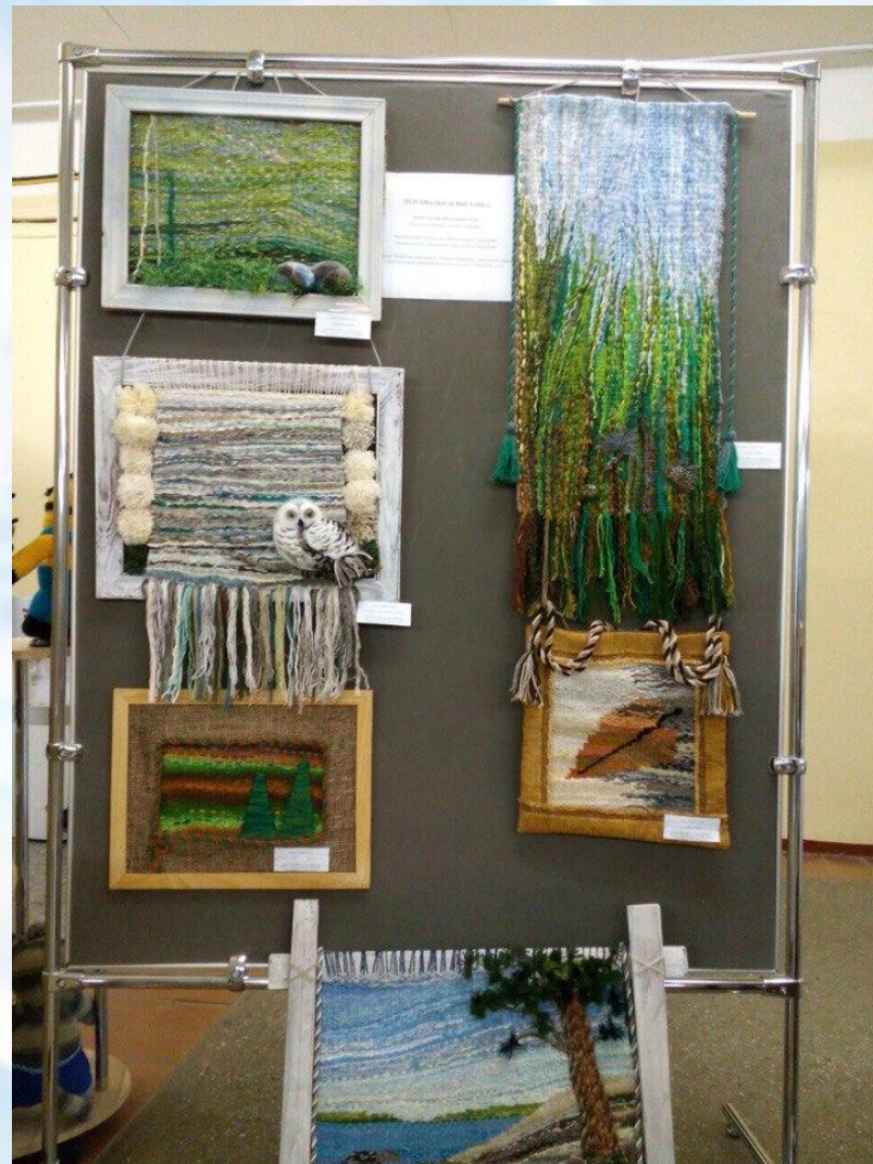
Творческий проект «Гобелены»