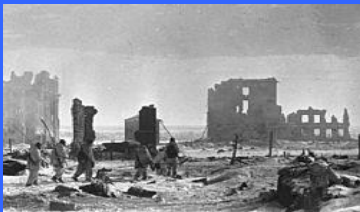
Центр города Сталинграда, 2 февраля 1943 года