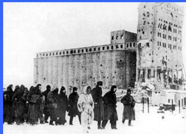
Пленённые под Сталинградом немецкие солдаты. Февраль. Позади — большое здание элеватора (генерал-фельдмаршал Паулюс лично разработал для своих солдат нашивку с изображением элеватора) 1943 года .