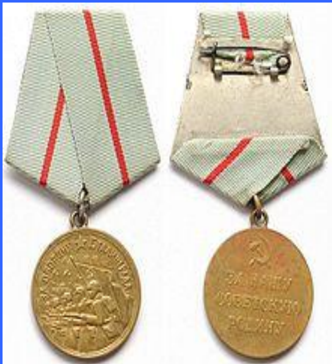
Медаль «За оборону Сталинграда»

В Советском Союзе учреждена медаль «За оборону Сталинграда», на 1 января 1995 года ею было награждено 759 561 человек.