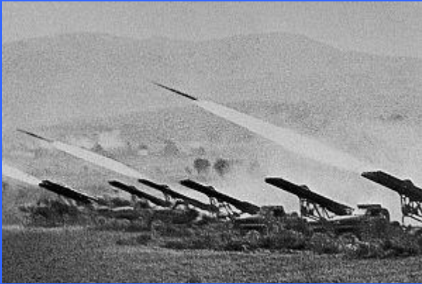
Артподготовка советского наступления

Ставка предложила вариант окружения и разгрома немецких войск под Сталинградом: Донскому фронту предлагалось нанести главный удар в направлении Котлубань, прорвать фронт и выйти в район Гумрак. Одновременно с этим Сталинградский фронт ведет наступление из района Горная Поляна на Ельшанку, и после прорыва фронта части выдвигаются в район Гумрак, где соединяются с частями Донского фронта. В этой операции командованию фронтами разрешалось использовать свежие части (Донской фронт — 7 сд, Сталинградский фронт — 7-й Ст. К., 4 Кв. К.). 7 октября вышла директива генштаба № 170644 о проведении наступательной операции двумя фронтами по окружению 6-й армии, начало операции назначено на 20 октября.