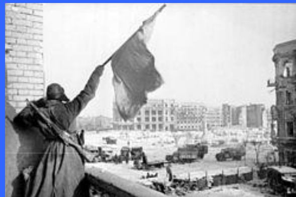
Флаг над освобождённым городом, Сталинград, 1943 год