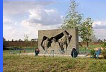
Памятник бою у села Новая Надежда