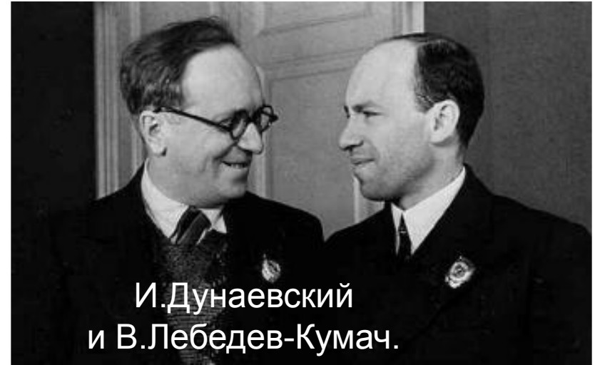
И.Дунаевский и В.Лебедев-Кумач.

Развитие музыки было связано с именами С.Прокофьева, Д. Шостаковича, Хренникова, И. Дунаевского. Появились музыкальные коллективы - Большой симфонический оркестр, квартет им.Бетховена Произведения И.Дунаевского, Б. Мокроусова, М.Блантера, братьев Покрасс знала вся страна.