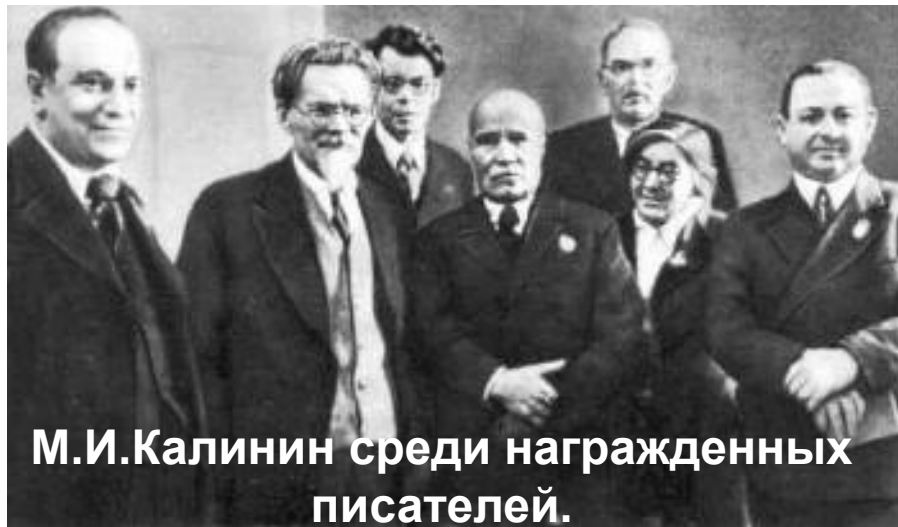
М.И.Калинин среди награжденных писателей.

М.Горький - «Жизнь Клима Самгина», «Егор Булычев и другие» А.Толстой - «Хождение по мукам» «Петр I». М.Шолохов, М. Булгаков, В.Каверин, А.Платонов и др.