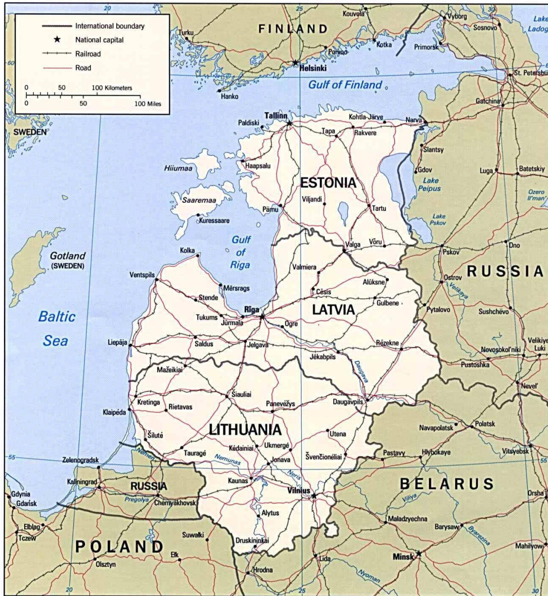
The Baltic States