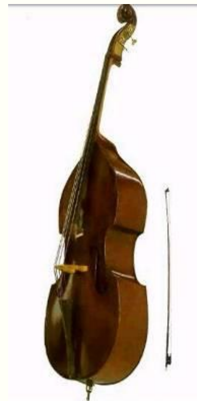
скрипка альт виолончель контрабас