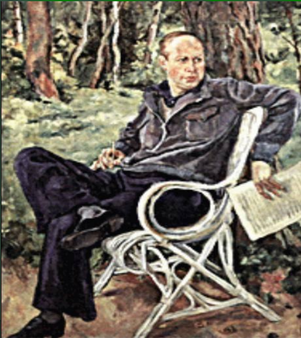
Сергей Сергеевич Прокофьев (1891-1953)