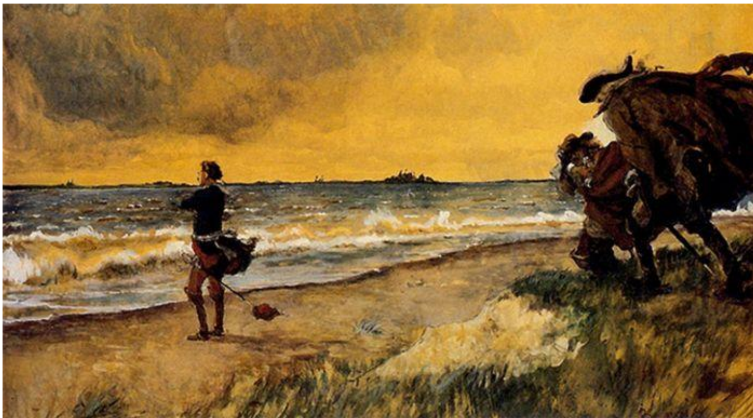
Бенуа А.Н. Петр Великий, думающий о строительстве Санкт-Петербурга, 1916