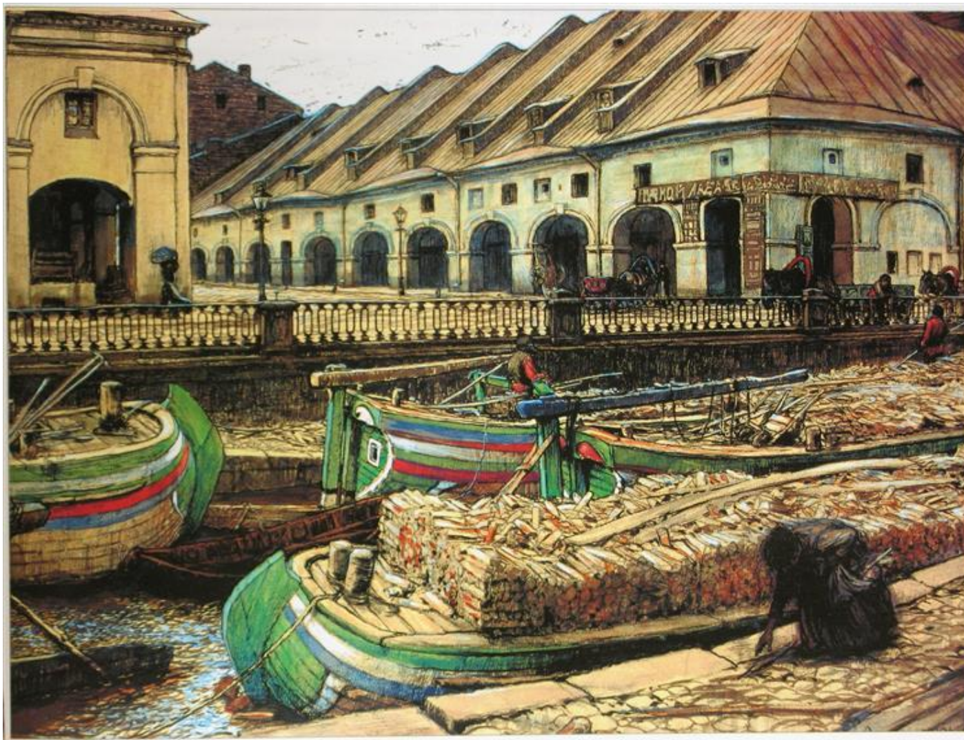
Лансере Е.Е. Старый Никольский рынок