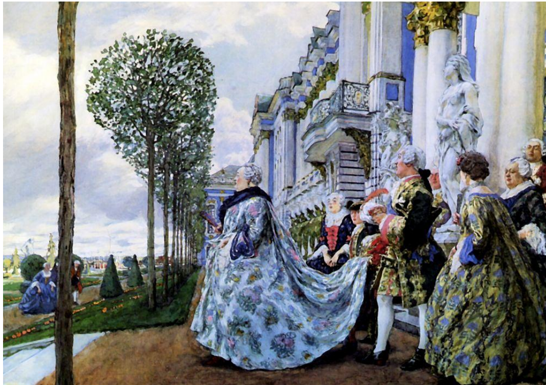
Лансере Е.Е. Императрица Елизавета Петровна в Царском, 1905