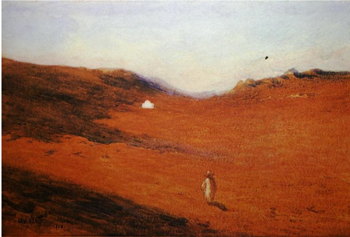
Бакст Лев Вечер в окрестностях Айн-Сейнфура. Сфакс 1897

Лев Самойлович Бакст (1866-1924) В творчестве Леона Бакста господствует другая тема : художественная интерпретация первоистока европейской цивилизации - античности. Ярче всего эта тема решалась художником в театрально-декорационном творчестве.