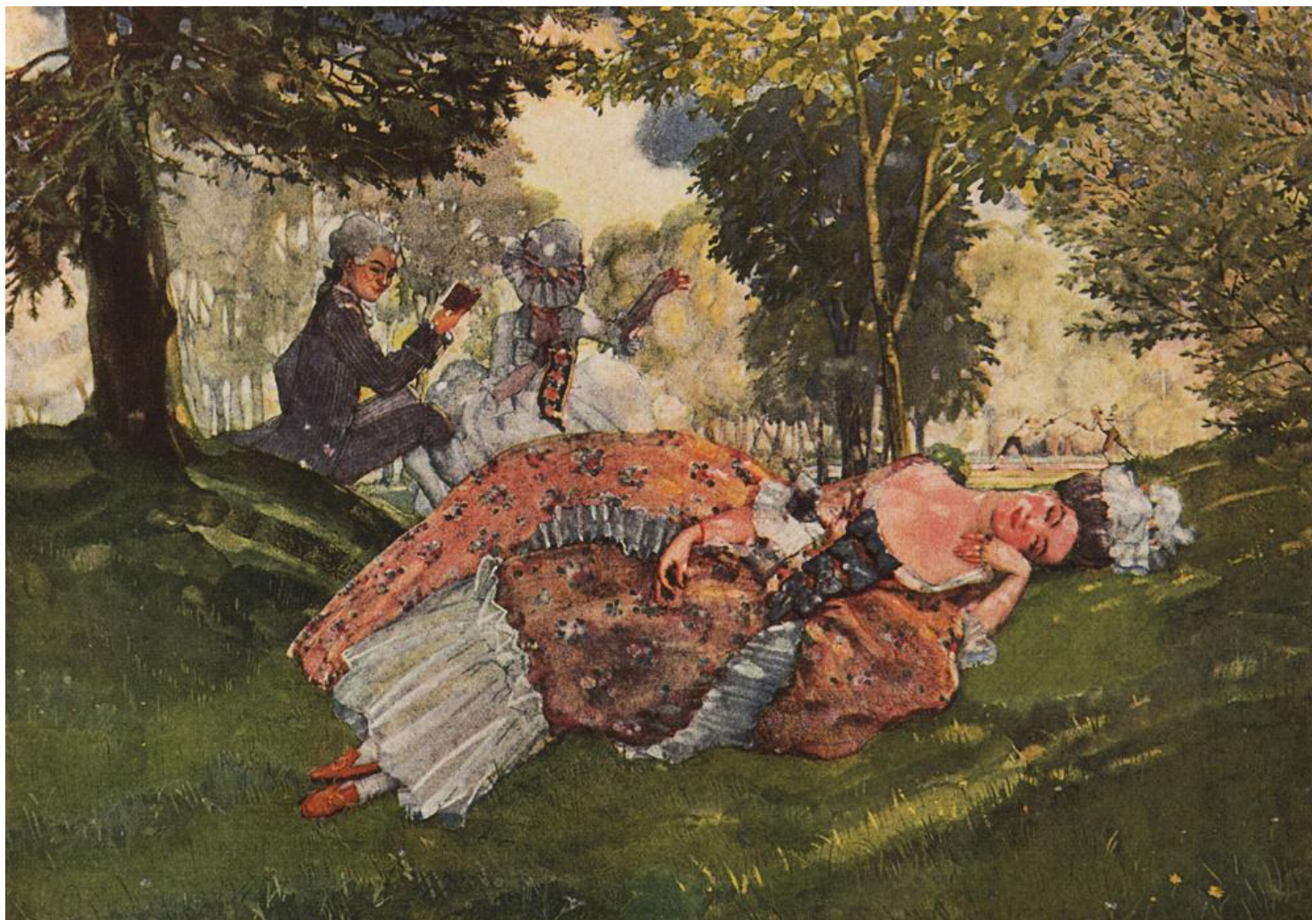
Сомов К.А. Заснувшая на траве молодая женщина, 1913