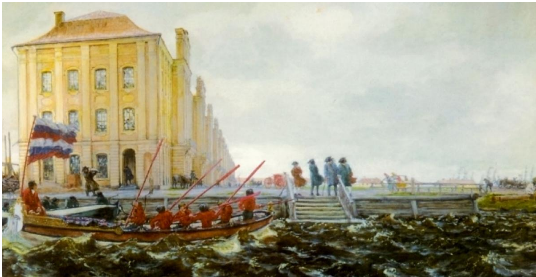
Лансере Е.Е. Петербург. Здание Двенадцати коллегий, 1903