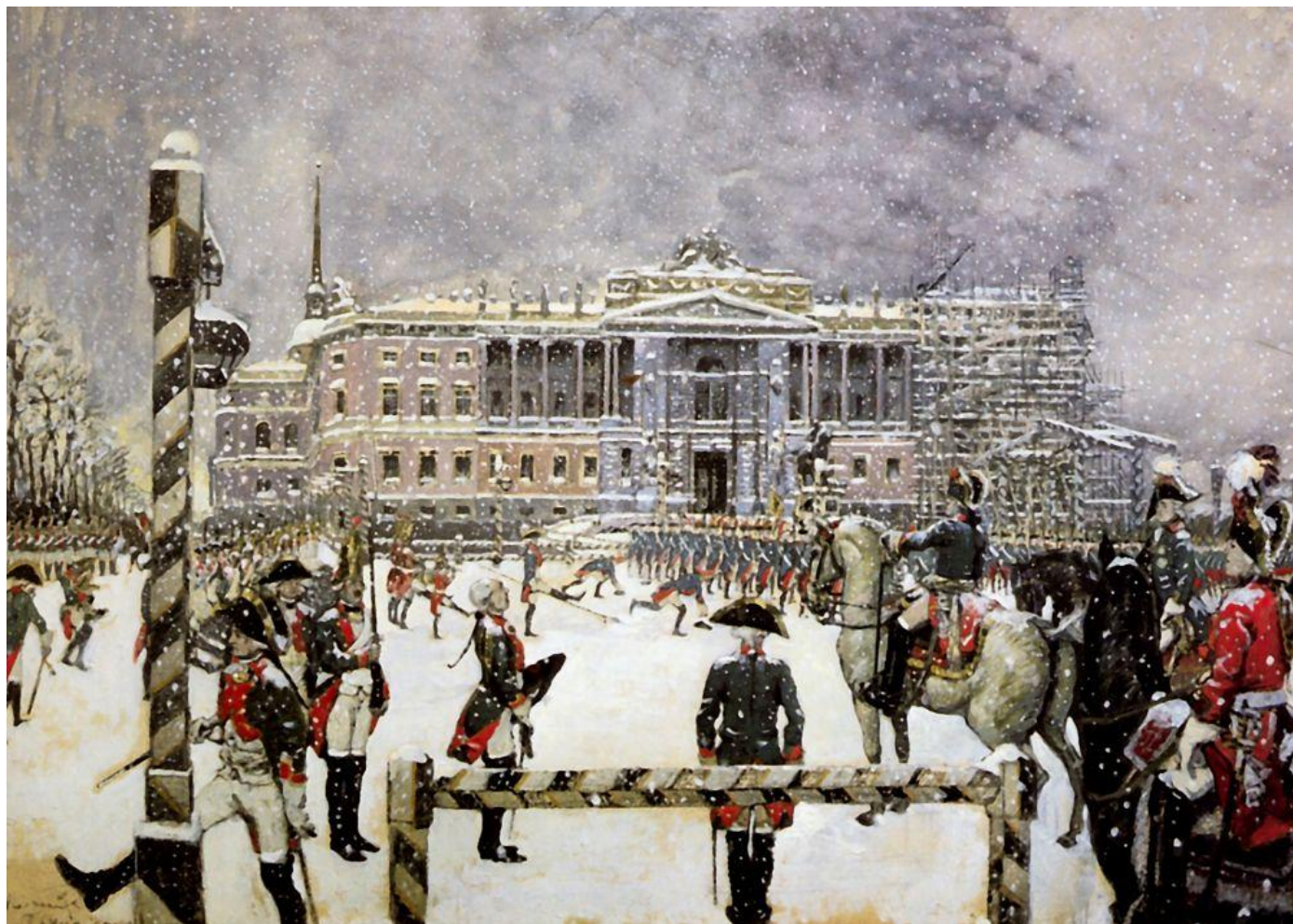
Бенуа А.Н. Парад в царствование Павла I, 1907