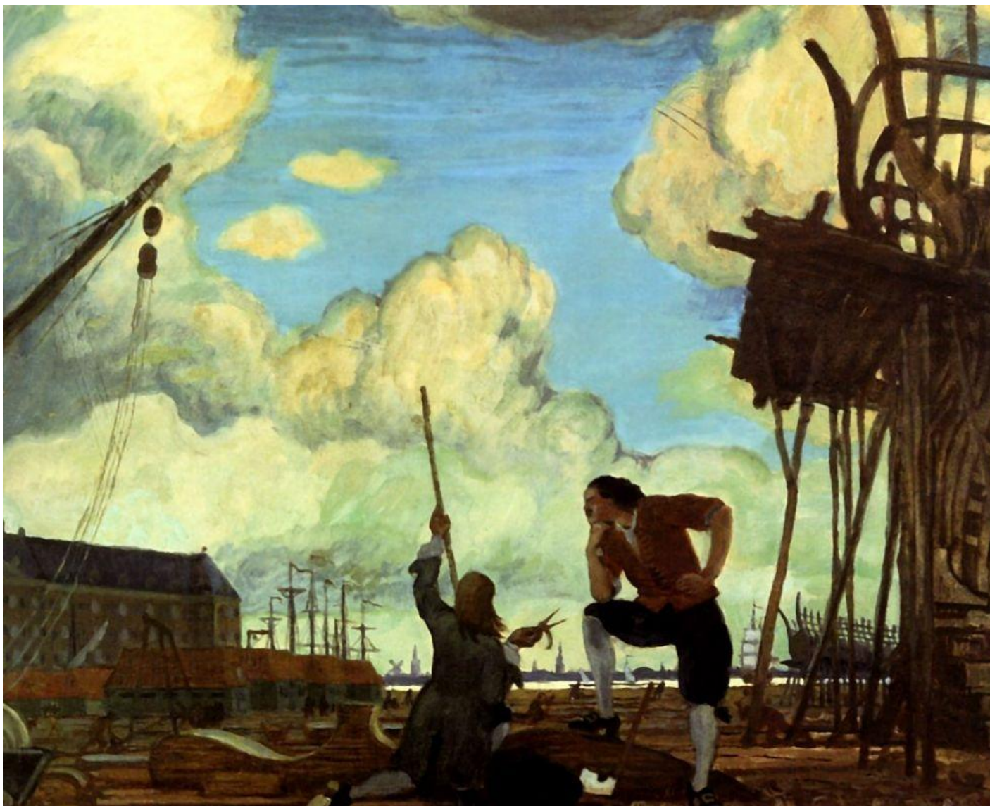
Добужинский М.В. Петр Великий в Голландии