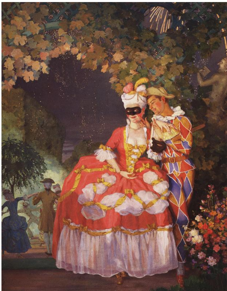
Сомов К.А. Арлекин и дама, 1921.