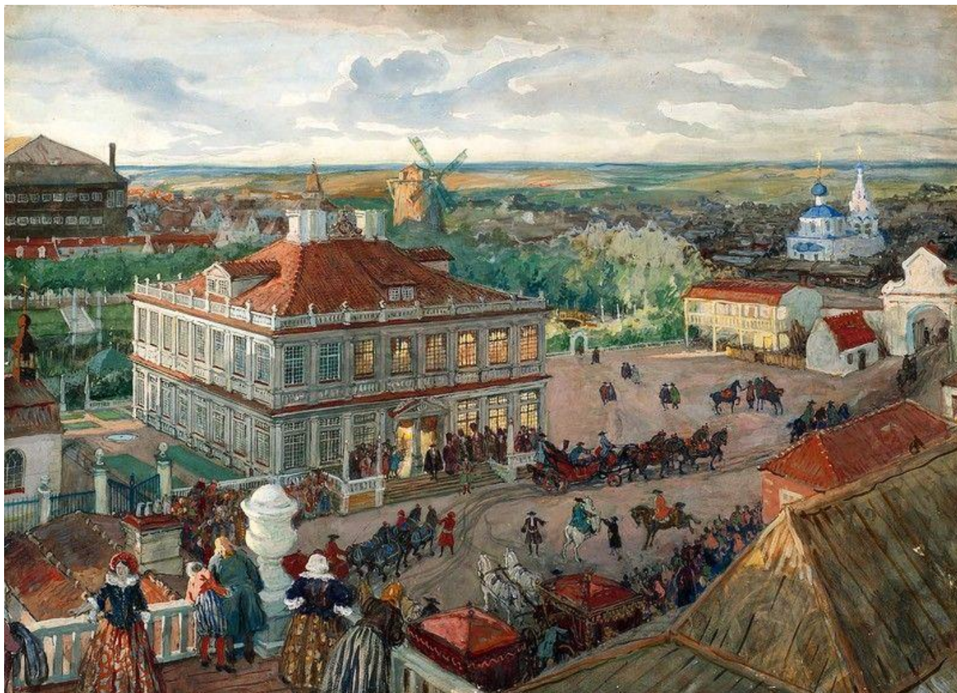
Бенуа, А.Н. В Немецкой слободе. Отъезд царя Петра I из дома Лефорта, 1909