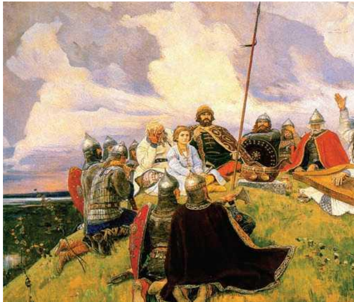
Иллюстрация к «Слову о полку Игореве». Художник В. Фаворский. 1954 г

Это не историческое повествование о далеком прошлом – это отклик на события своего времени, полного еще не притупившегося горя.