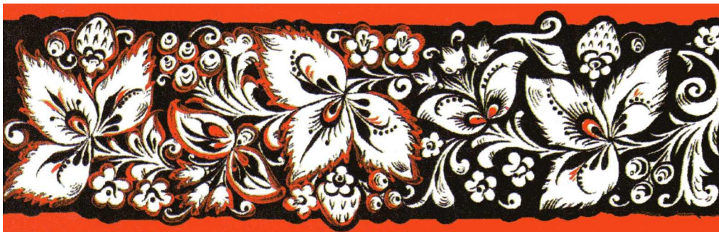
Разновидность фонового письма – « кудрина»