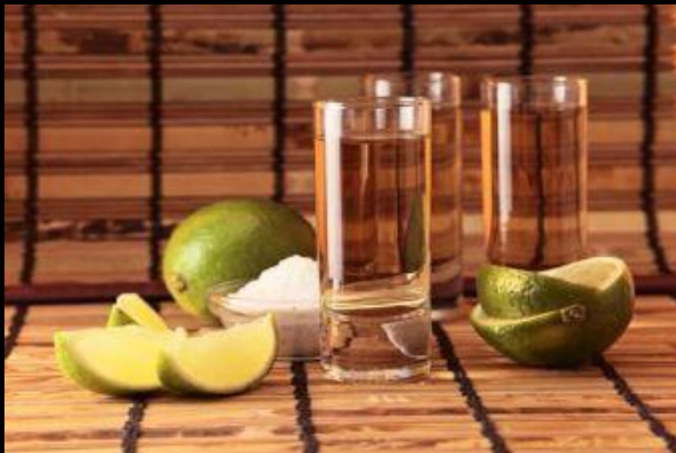
Текила с солью и лаймом