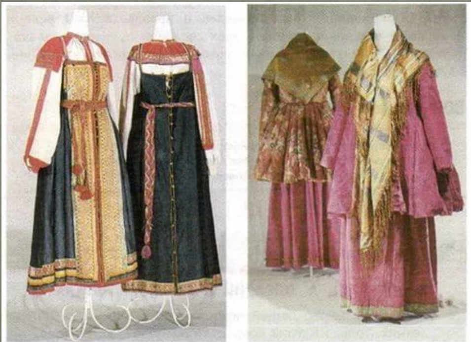
Летняя и зимняя женская крестьянская одежда.