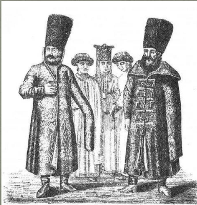
Одежда бояр и боярынь в XVII веке.