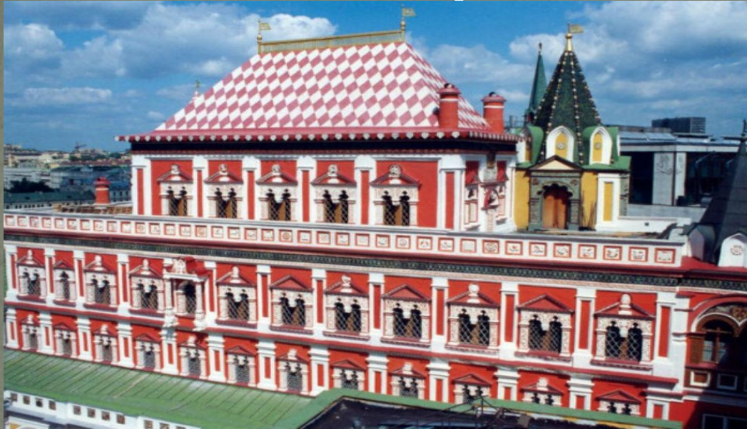
Теремной дворец Московского Кремля