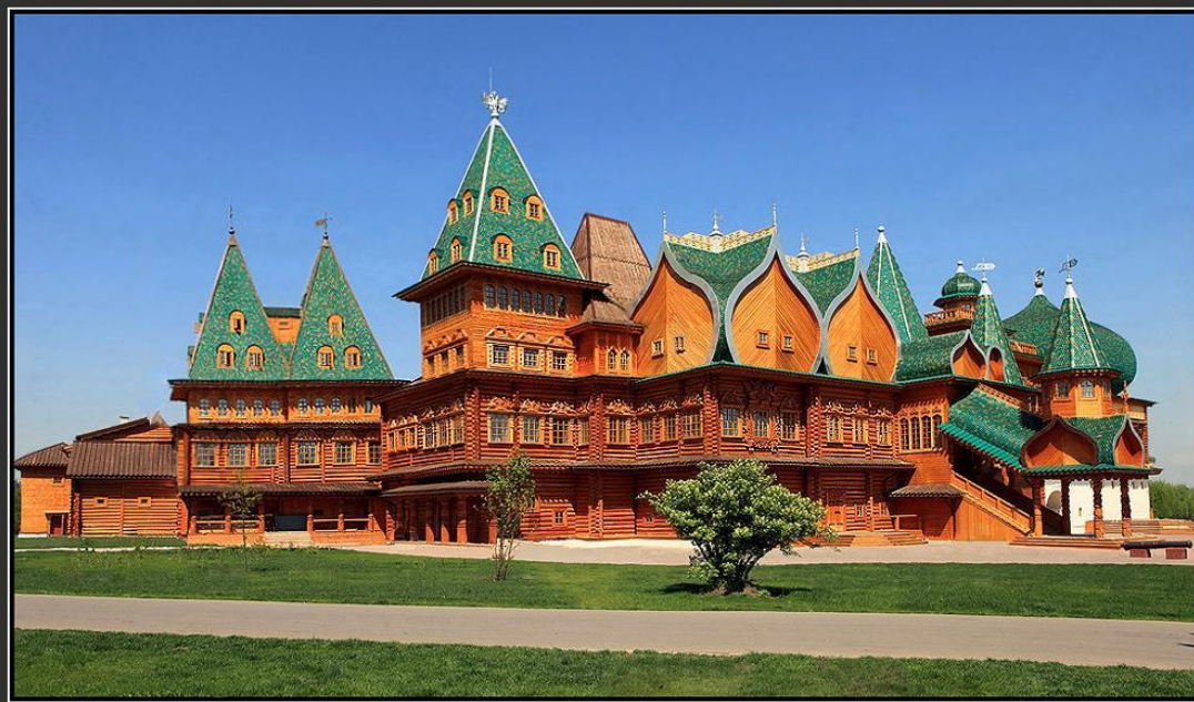
Летний дворец в селе Коломенском