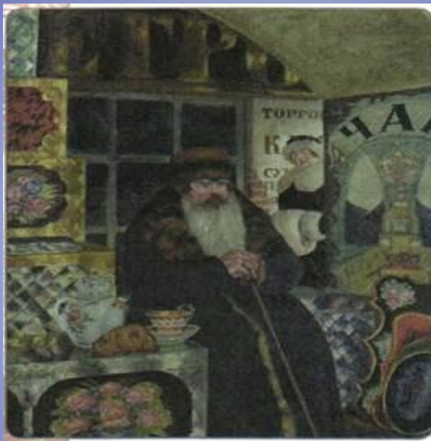
Купец-сундучник. Художник Б. М. Кустодиев