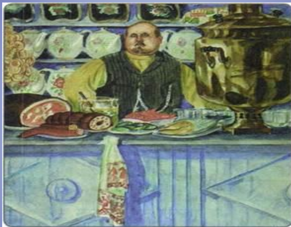
Трактирщик. Художник Б. М. Кустодиев