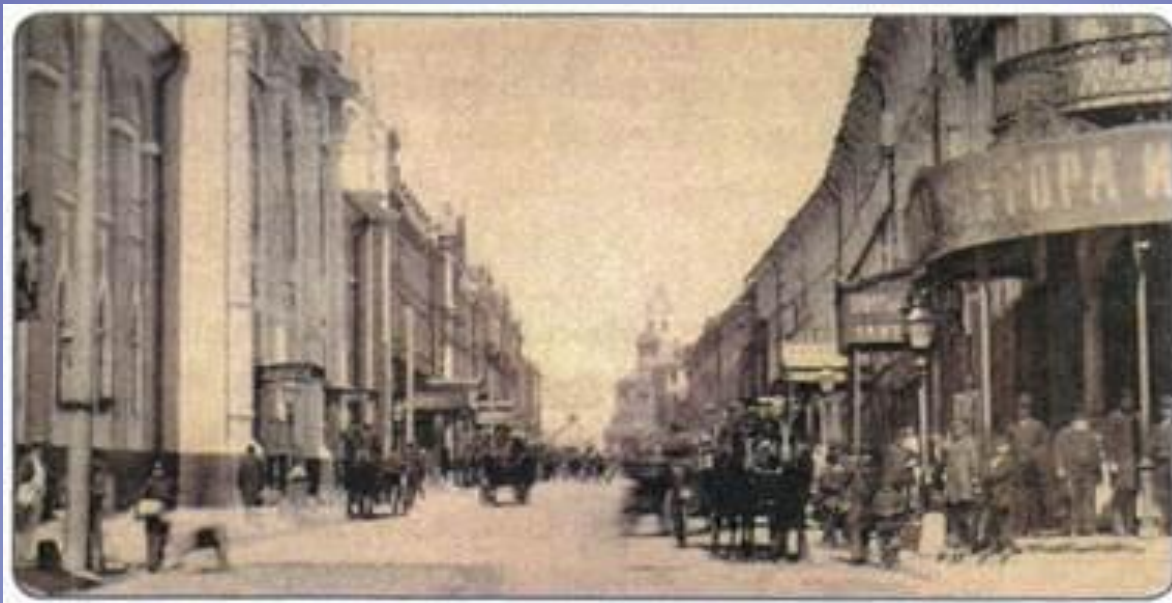
Вид Никольской улицы в Москве. Конец XIX в.