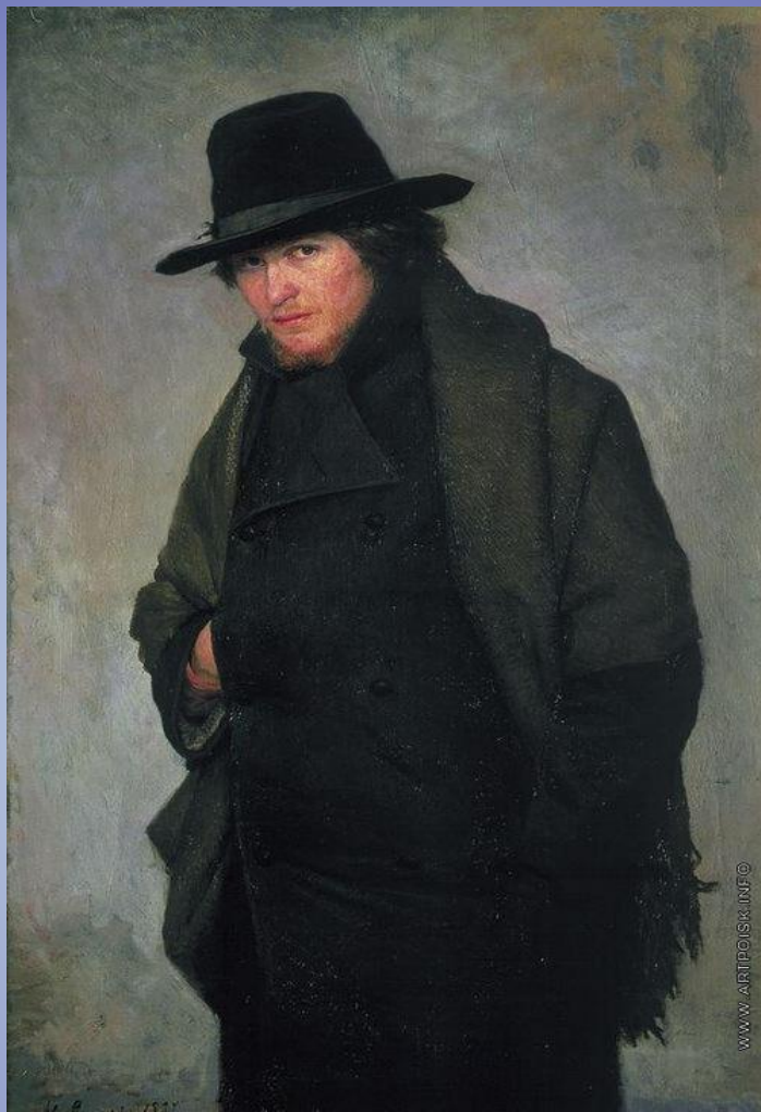
Н. А. Ярошенко. Студент