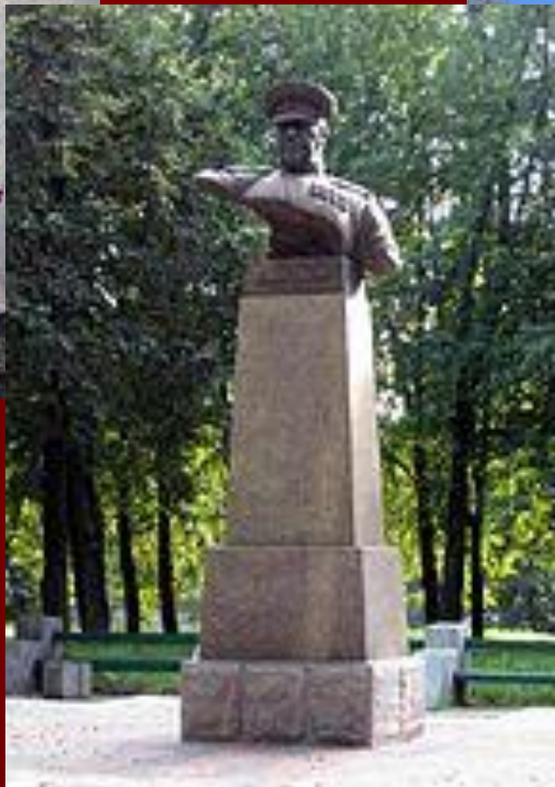
Памятник Жукову в Минске