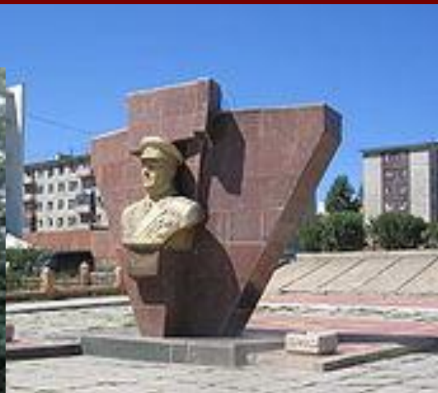
Памятник Жукову в Улан - Баторе (Монголия)