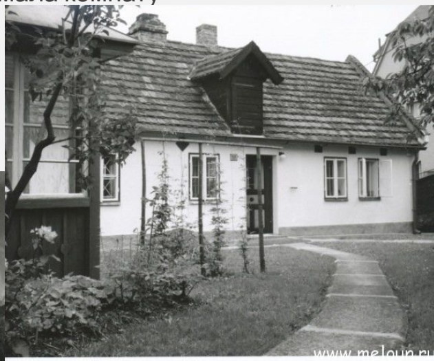
Ноябрь 1922 - август 1923 - дом пана Грубнера