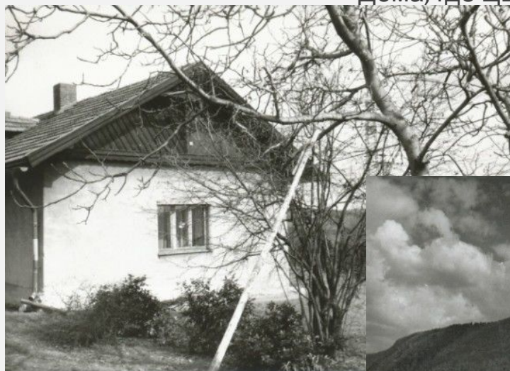
Август, 1922 год — дом лесника