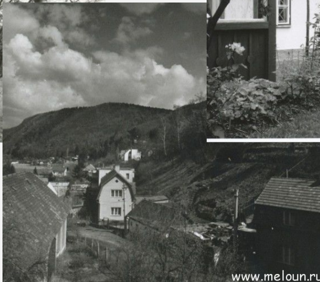
Сентябрь 1922 год — дом пана Саски