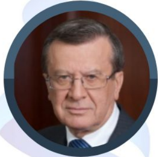
Виктор Алексеевич Зубков

Председатель Совета директоров ПАО «Газпром», Специальный представитель Президента РФ по взаимодействию с Форумом стран-экспортеров газа