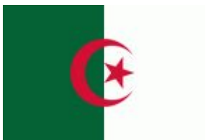
Алжир Филиал Gazprom International в Алжире