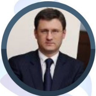
Александр Валентинович Новак

Министр сельского хозяйства Российской Федерации