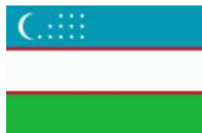
Узбекистан Операционная компания «Зарубежнефтегаз ГПД Центральная Азия»