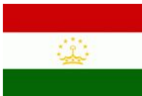
Таджикистан Представительств во Gazprom International в Таджикистане