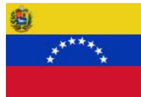
Венесуэла Gazprom Latin America В.У., филиал в Венесуэле