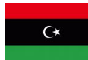
Ливия Представительств во Gazprom International в Ливии