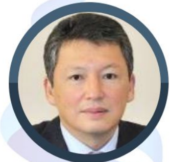
Тимур Аскарлович Кулибаев

Заместитель Председателя Совета директоров ПАО «Газпром», Председатель Правления ПАО «Газпром»