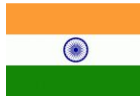
Индия Представительс тво Gazprom International в Индии