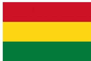
Боливия Представительств о Gazprom International в Боливии