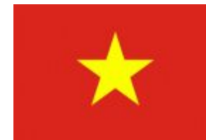
Вьетнам Совместная операционная компания (СОК) «Вьетгазпром»