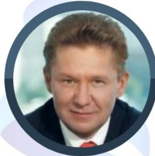
Алексей Борисович Миллер

Председатель Совета директоров ПАО «Газпром», Специальный представитель Президента РФ по взаимодействию с Форумом стран-экспортеров газа