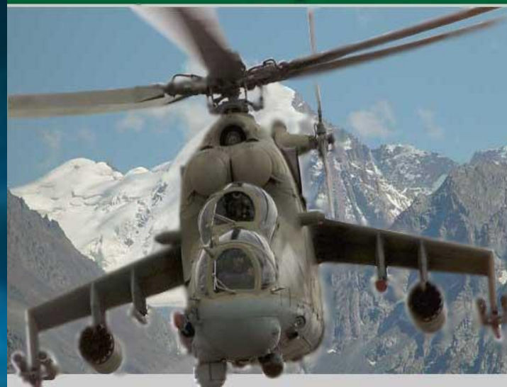
Авиация пограничных войск в Афганистане