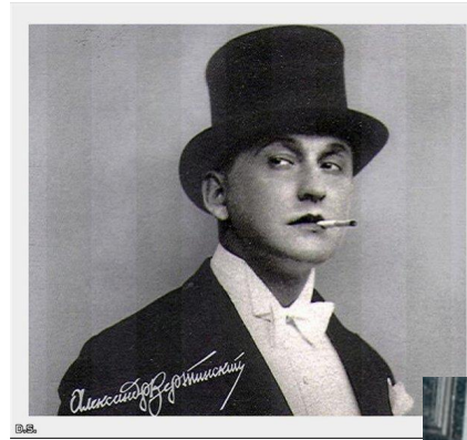
Александр Николаевич Вертинский

Поп-музыка развивалась в СССР и России со второй половины XX века по западному прообразу. Она популярна в первую очередь среди русскоязычного населения. В западных странах российские поп-музыканты редко достигают большого коммерческого успеха. В русском языке существует собирательно-ругательное название поп-музыки — « попса ».