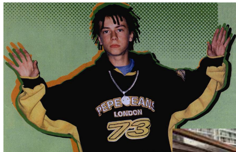
Децл российский рэпер