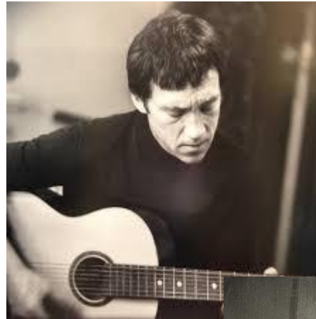
Владимир Семёнович Высоцкий

На фоне распада СССР также возникла сцена тяжелой русскоязычной рок-музыки разных жанров: метала , хардкора и т. п.