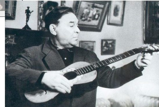
Леонид Осипович Утёсов советский эстрадный артист — певец, чтец, руководитель оркестра; киноактёр

выдающийся русский и советский эстрадный артист, киноактёр, композитор, поэт и певец