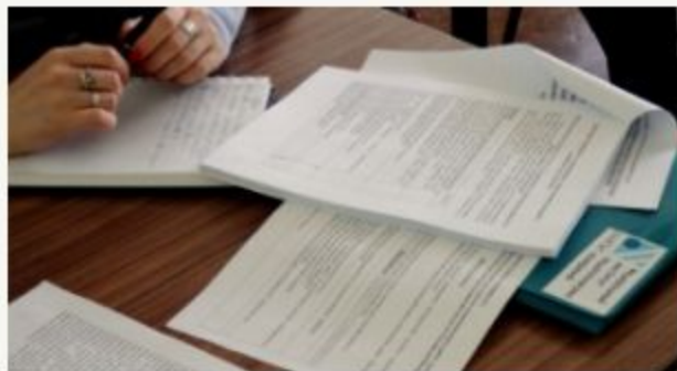
График дистанционных курсов повышения квалификации ФИПИ для экспертов региональных предметных комиссий в период январь - апрель 2019 г.

Курсы повышения квалификации для экспертов региональных предметных комиссий