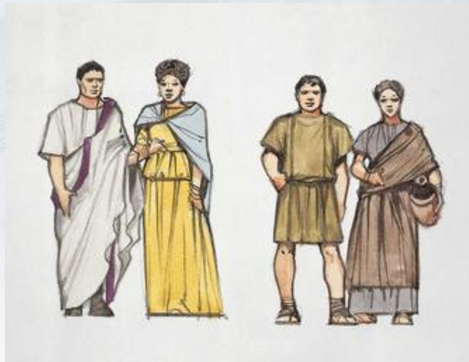
Патриции и плебеи

Плебеи требовали равные права на владение землей, отмены долгового рабства. Плебеи начали борьбу с патрициями. Продолжалась она 200 лет и закончилась победой плебеев.