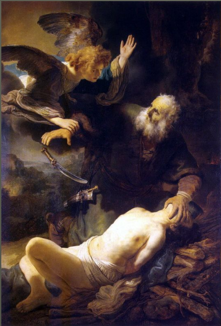
«Жертвоприношение Исаака». 1635. Санкт- Петербург, Эрмитаж

Это один из самых драматических моментов в Ветхом Завете. Авраам по велению свыше готов принести своего единственного сына Исаака в жертву Богу и уже занес над ним, связанным, нож, чтобы заколоть его для всеожжения. На картине Исаак лежит на жертвеннике поверх дров. В Священном Писании ангел Господень взывает к Аврааму, прошедшему испытание на покорность Богу, и велит ему остановиться. Рембрандт усиливает драматизм происходящего: на картине ангел схватил Авраама за кисть и нож падает. Сцена выигрывает в убедительности еще и потому, что большая ладонь Авраама закрыла сыну лицо, голова Исаака запрокинута и кажется, что в горло вот-вот вонзится нож.