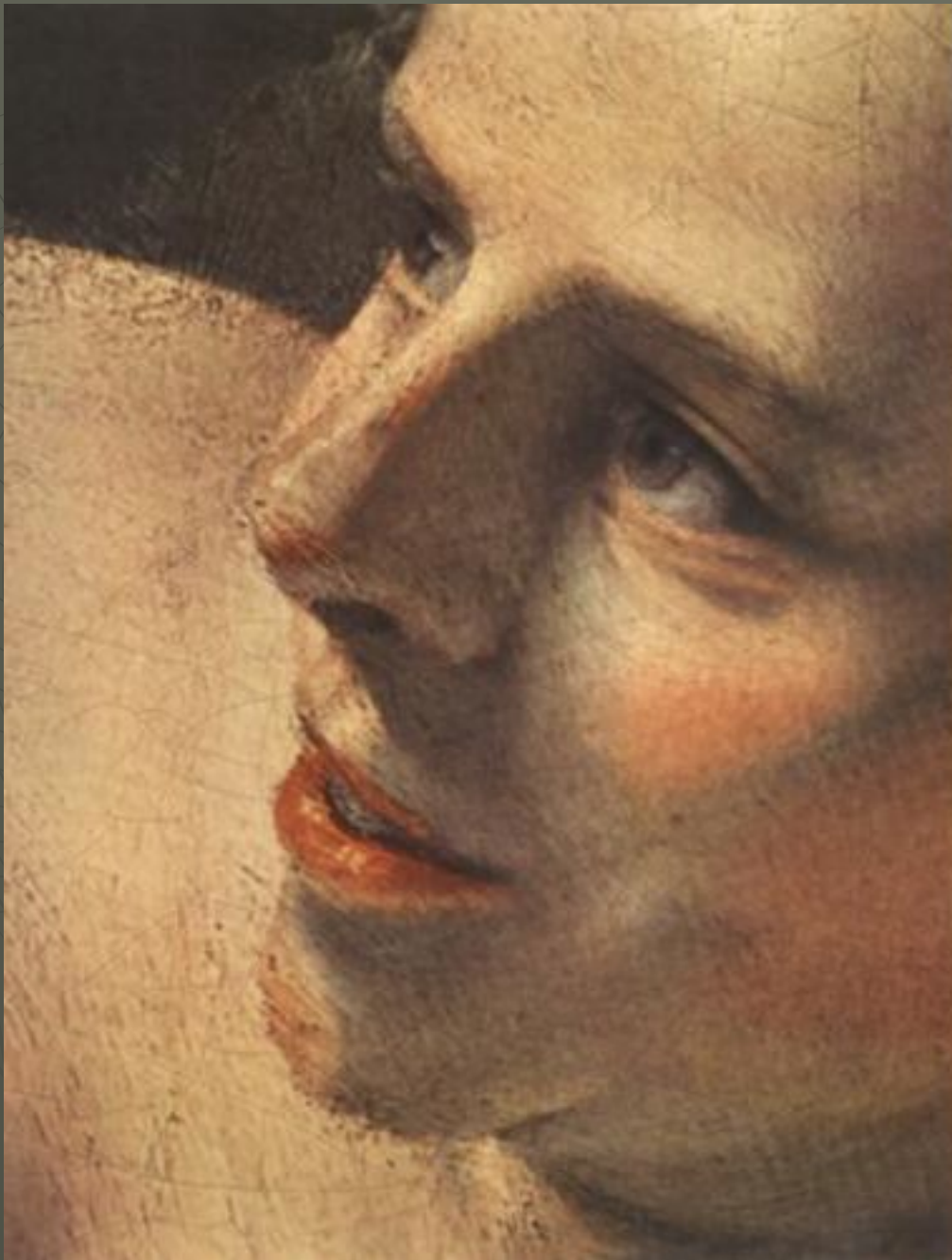
«Даная», деталь, 1636-47. Холст, масло, 165х203. Государственный Эрмитаж, Санкт- Петербург