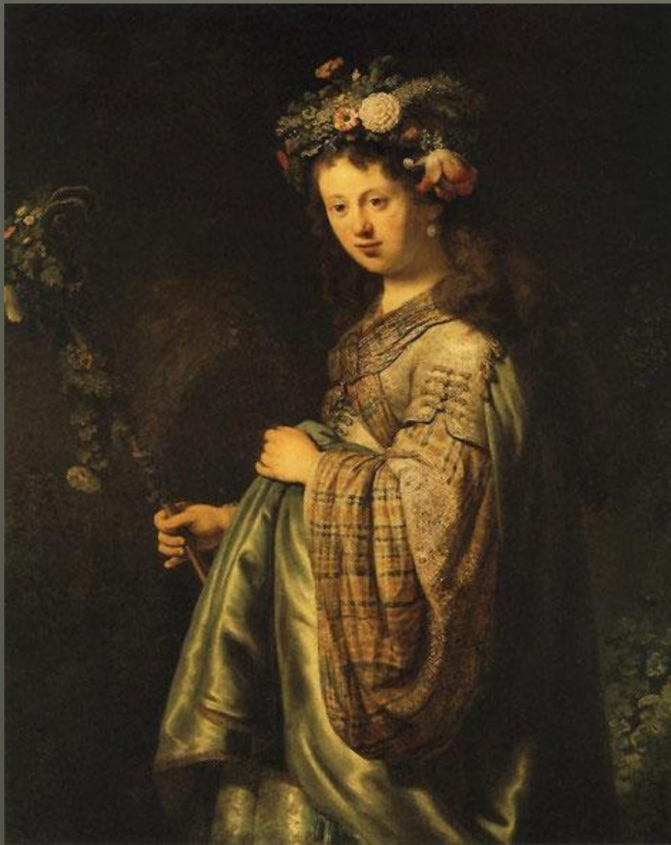
Рембрандт «Флора» 1634. Холст, масло. 124,7 x 100,4. Государственный Эрмитаж