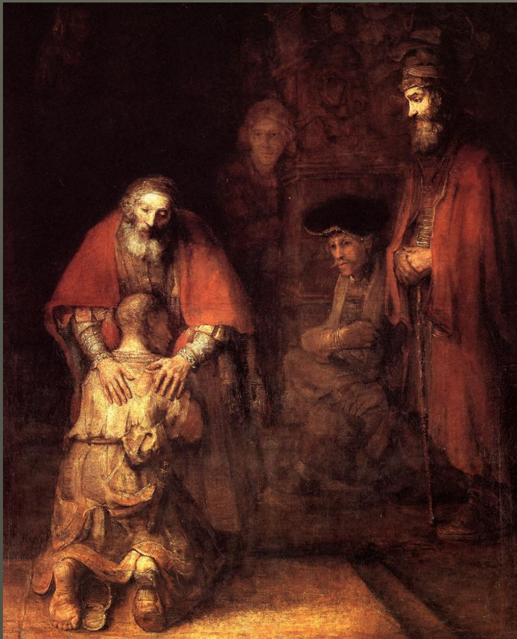
Рембрандт «Возвращение блудного сына»