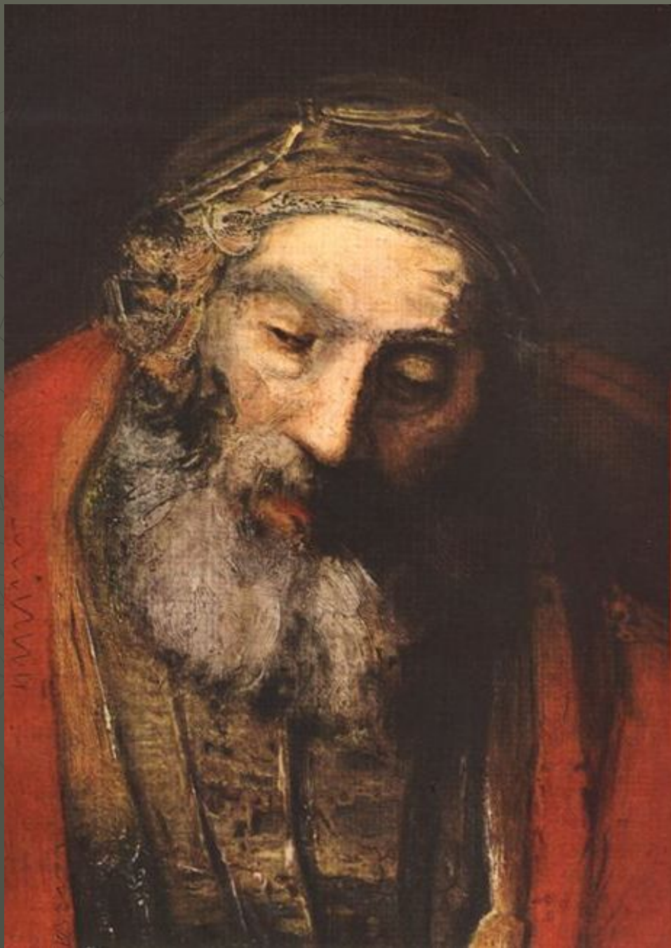
«Возвращение блудного сына». Деталь, 1669.