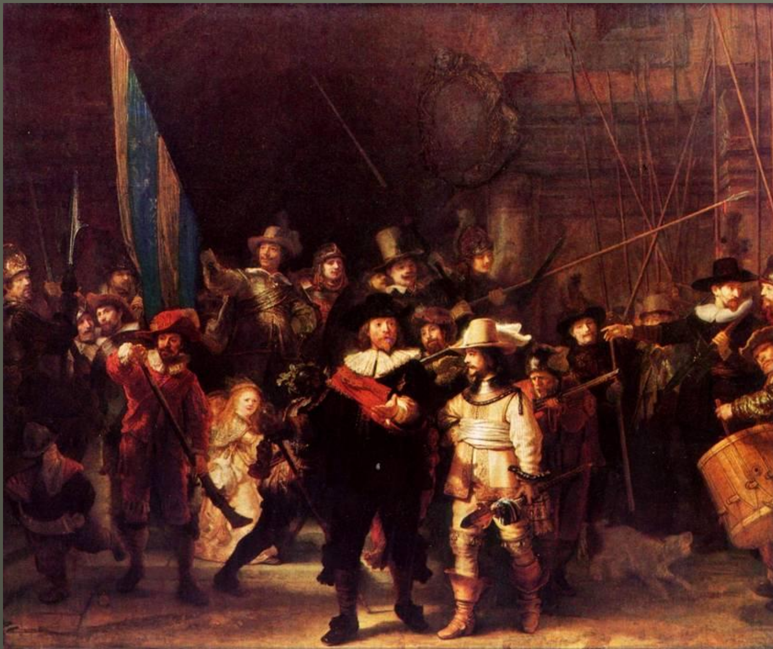
Рембрандт. «Выступление стрелковой роты капитана Баннинга Кока» («Ночной дозор») 1642. Холст, масло. 359 x 438. Рейксмузеум, Амстердам