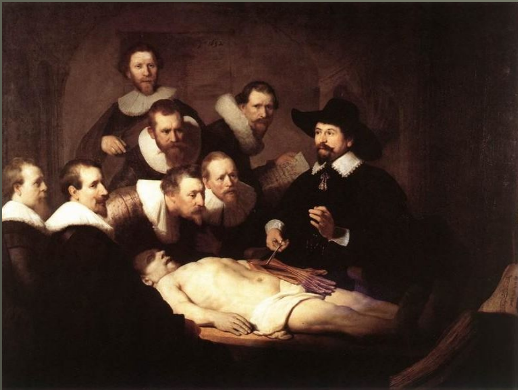
Рембрандт. «Урок анатомии доктора Тульпа» 1632 Холст, масло. Маурицхейс, Гаага