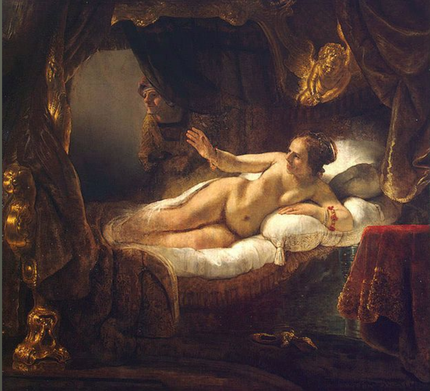
Рембрандт. «Даная» (1636; 1646-47)