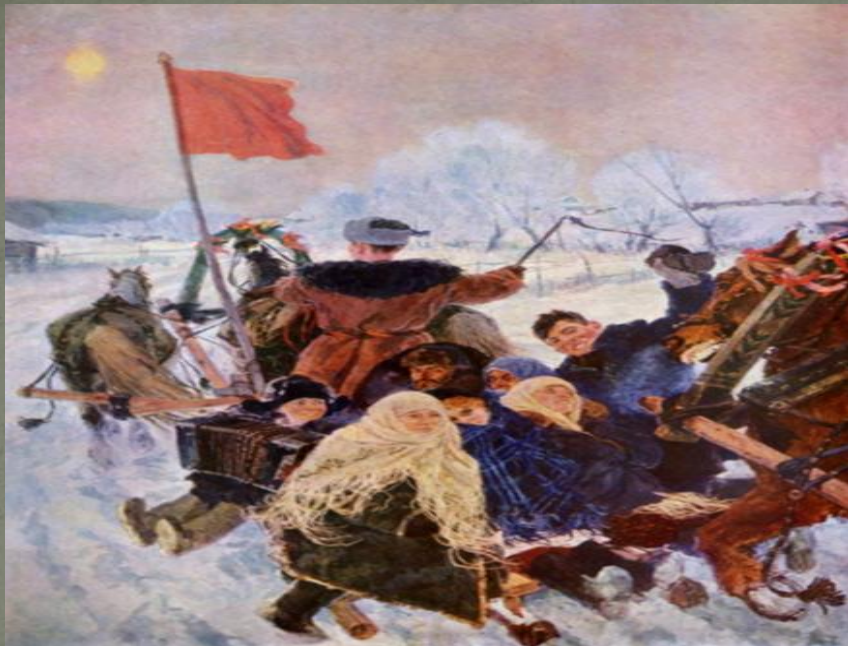
«Едут на выборы»