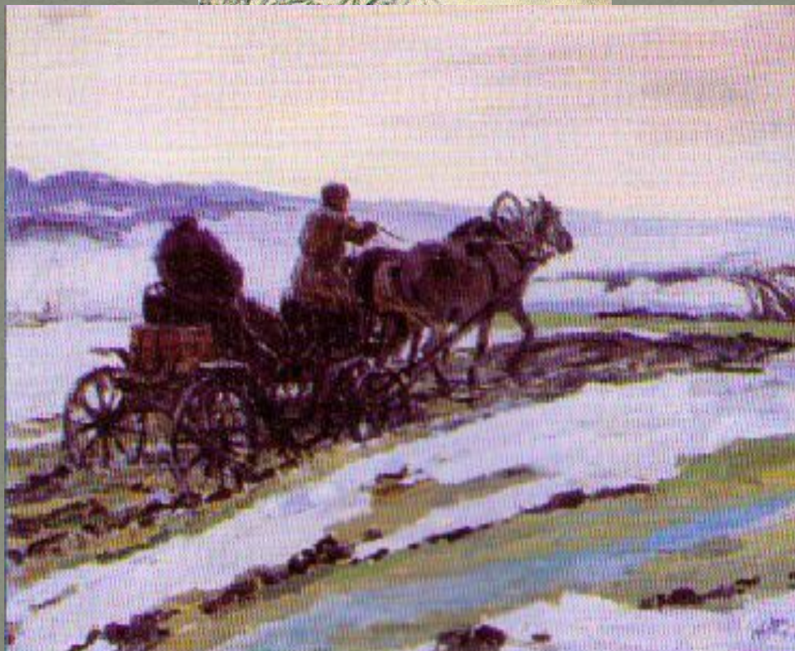
«мельница» «Мартовское утро»

«Надо, чтобы человек непреходящую невероятную красоту мира чувствовал ежечасно, ежеминутно. И когда поймёт он эту удивительность громоподобность бытия – на всё тогда его хватит: и на подвиг на работе, и на защиту Отечества, на любовь к детям, к человечеству всему. Вот для этого и существует живопись...» (А.Пластов из письма к сыну).