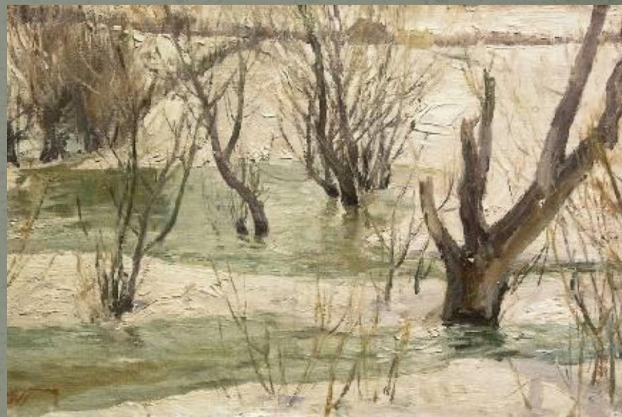
«Ветлы в вешней воде»

Огонь, земля, вода... Былинные богатыри... причём же здесь прислонихинский художник А.А.Пластов? Так это его называли одним из последних богатырей земли русской. А силу и удивительную ценность его таланта до сих пор хранят его полотна.