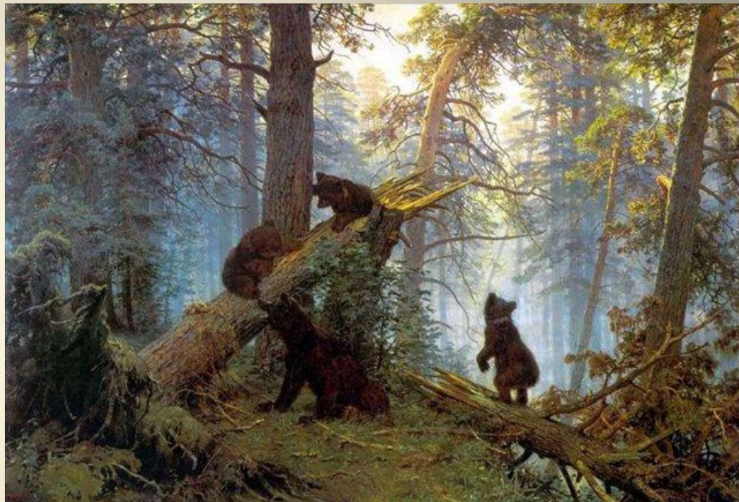
"Утро в сосновом бору"

Пожалуй, самая известная картина выдающегося русского пейзажиста И. И. Шишкина – «Утро в сосновом лесу». Картина была написана в 1889 году. Возможно, именно занимательный сюжет картины способствовал ее популярности, однако настоящая ценность полотна определяется точно переданным состоянием природы.