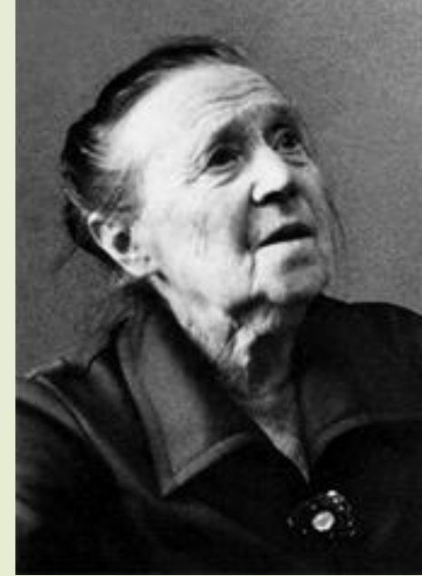
Зейгарник Б. В.