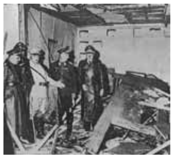
Ставка Гитлера 20 июля 1944 г.

В августе 1944 г. началось Словацкое национальное восстание. Немцам удалось остановить наступление советских войск и восстание было подавлено. Несмотря на эти успехи в Германии многие осознавали неизбежность поражения.