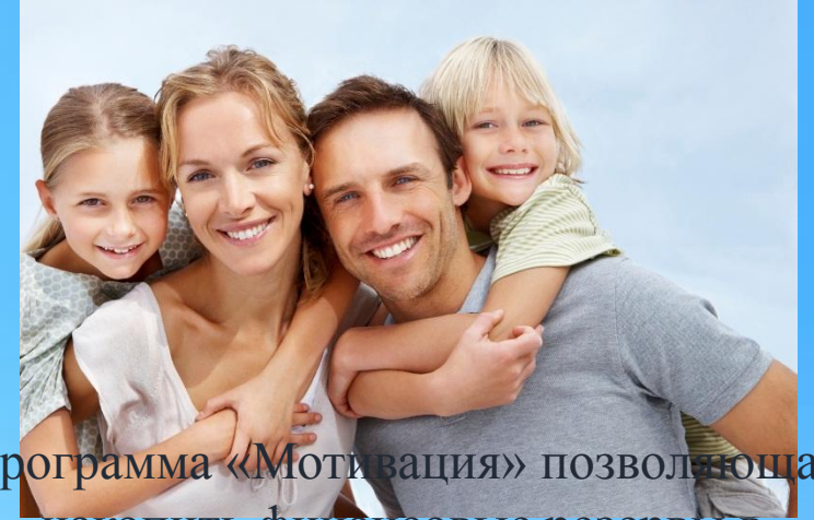
Программа «Мотивация» позволяющая накопить финансовые резервы в негосударственном пенсионном фонде