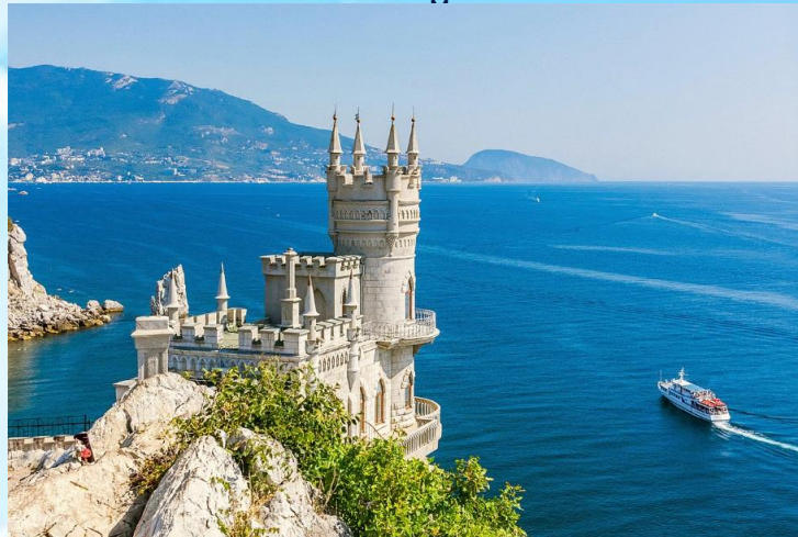
курортное лечение в санаториях и пансионатах, домах отдыха п-ова Крым