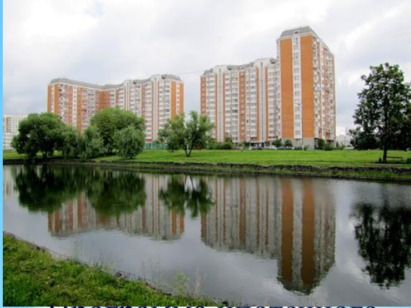
Программа ипотечного кредитования