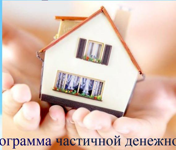
Программа частичной денежной