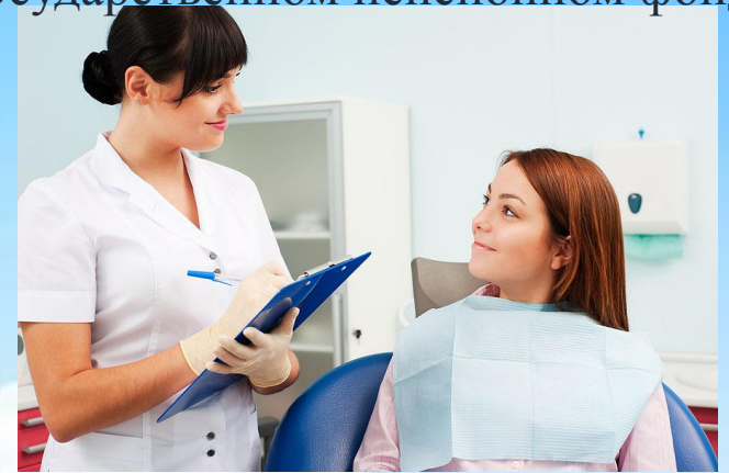
Программа добровольного медицинского страхования