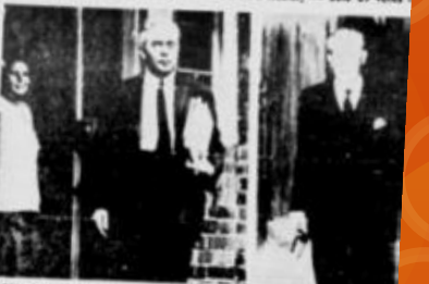
LONDRES.— El jefe del partido laborista, Harold Wilson, a la izquierda, y Harold Macmillan, expusero en momentos de hacer su entrada a la Cámara donde el primero dirigió su delfín contra el gobierno por el "Escándalo Profumo" debate, Macmillan obtuvo un voto de confianza por medio de una mayoría de dos votos