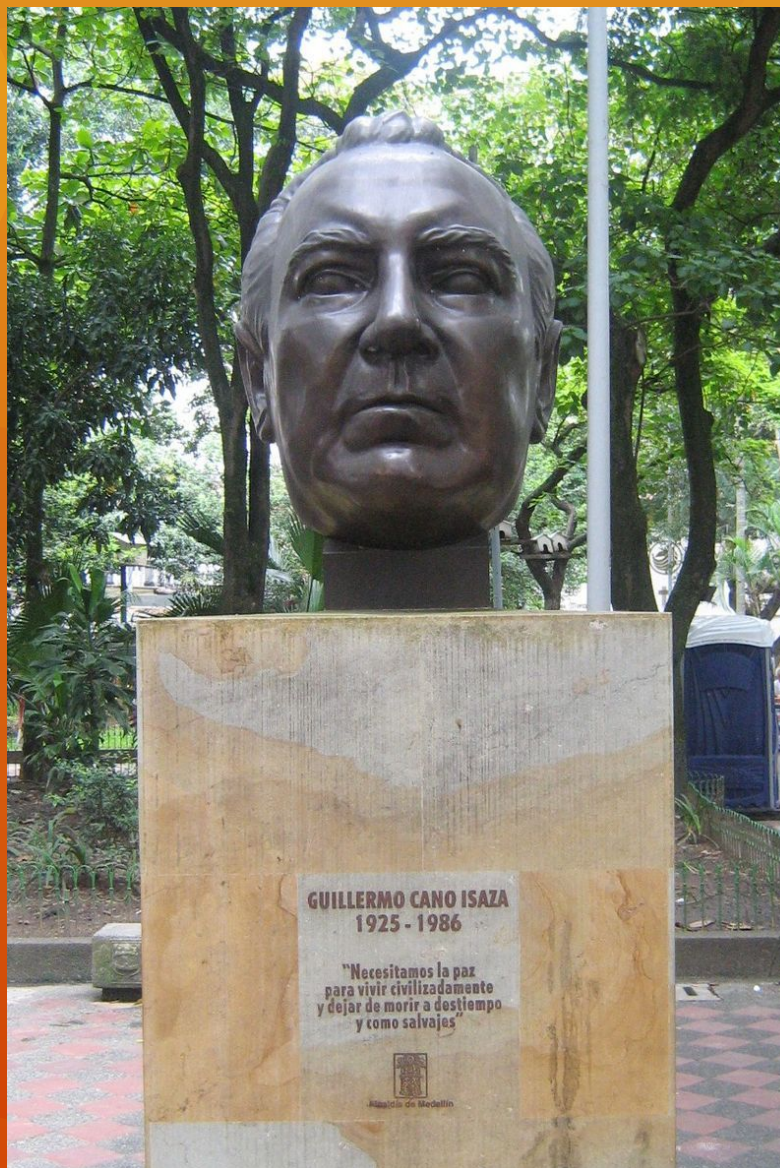
Бюст Гильермо Кано