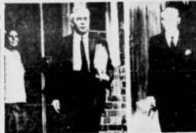
LONDRES. — El jefe del partido laborista, Harold Wilson, a la izquierda, y Harold Marañón, aparecen en momentos de hacer su entrada a la Cámara donde el primero dirigió un debate contra el gobierno por el "Estado de Proceso al debate, Marañón obtiene un voto de confianza por medio de una mayoría."

de Alfabetización, (Ver página 12). * * * El Gobierno Creó Comité Nacional de Acción Cívica (Ver página 13). * * * El Diliberado de Antioquia Será Instalado el 20 (Ver página 12).