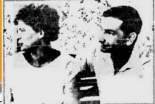
MUSCO. — Los astronautas rusos Valentin Tereshchenko y Valery Zhykashko, quienes actualmente giran en sus mesas espaciales alrededor de la tierra, aparecen durante el período de entrenamiento en algún lugar de la Unión Soviética.

Valentin cometió un error: se quedó dormido, pero después presentó excusas.—Los dos en su viaje a la misma velocidad, 77 vueltas a la tierra. Han hecho hasta ayer: más de dos millones de kilómetros recorridos, el cumpleaños el primer día de vuelo simultánea. Admisión mundial.