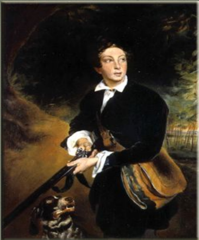
А.Толстой в юности, Худ. К.Брюллов