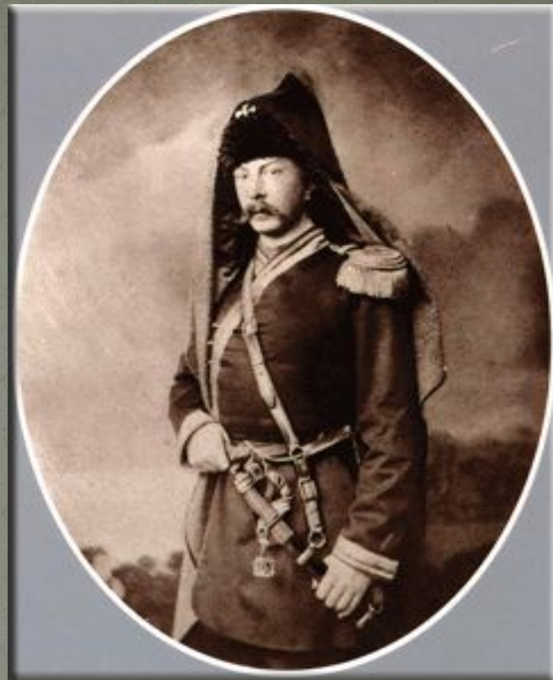
А.К. Толстой в мундире офицера Стрелкового полка, 1855 г.