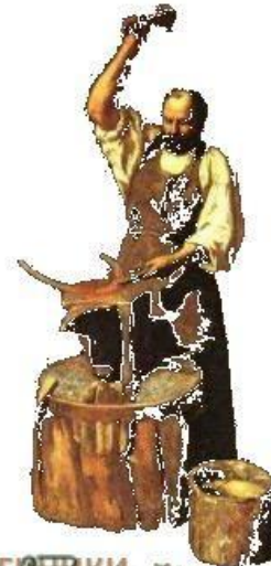
РЕМЕСЛЕННИКИ городские низы