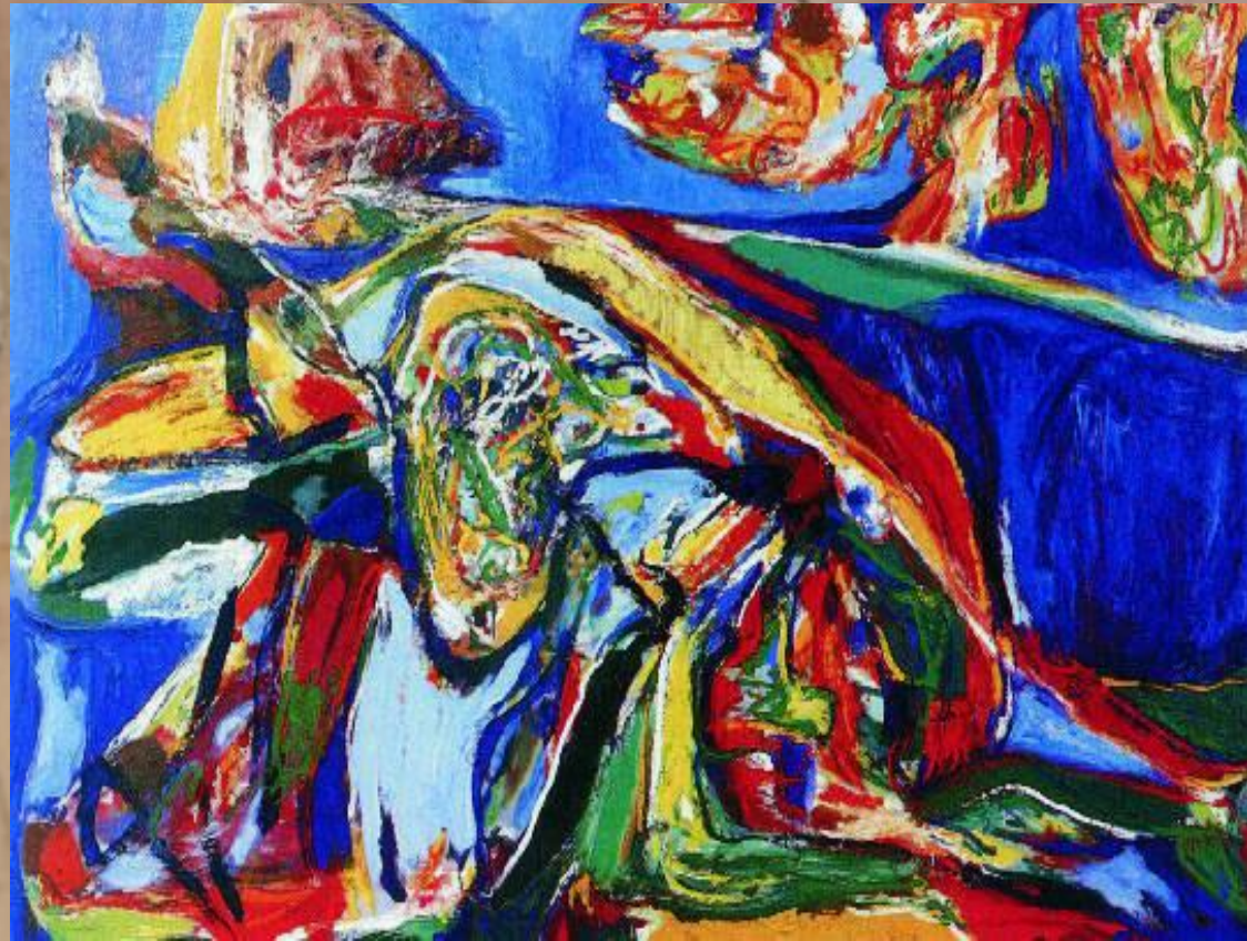
Панорама Киото (Асгер Йорн)

Америке называлось «живописью действия» — спонтанное энергичное нанесение краски исключительно под влиянием психических и эмоциональных состояний. Однако в отличие от своего американского собрата ташизм характеризовался менее агрессивной манерой письма, большим вниманием к цвету, легкостью форм. Да и сам Вольс, изобретатель этого метода, отрицал абсолютную случайность в своей работе. Он считал, что, художник инстинктивно проникает в какие-то глубинные процессы бытия. Поэтому некоторые картины ташистов представляли собой бьющие по психике резкостью форм и мрачной цветовой гаммой абстрактные полотна, выражающие трагико-пессимистический взгляд на мир, другие вызвали ассоциации с природными явлениями — водными стихиями, горными ландшафтами