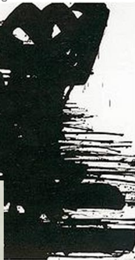
структуры Шестой • Живопись 1967 уровень Пьер Сулаж. структуры