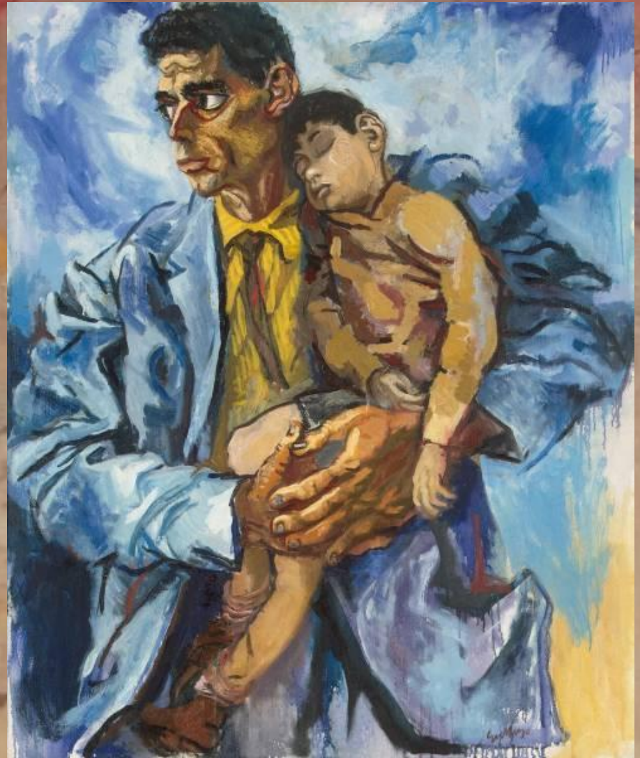
Рокко с сыном, Ренато Гуттузо