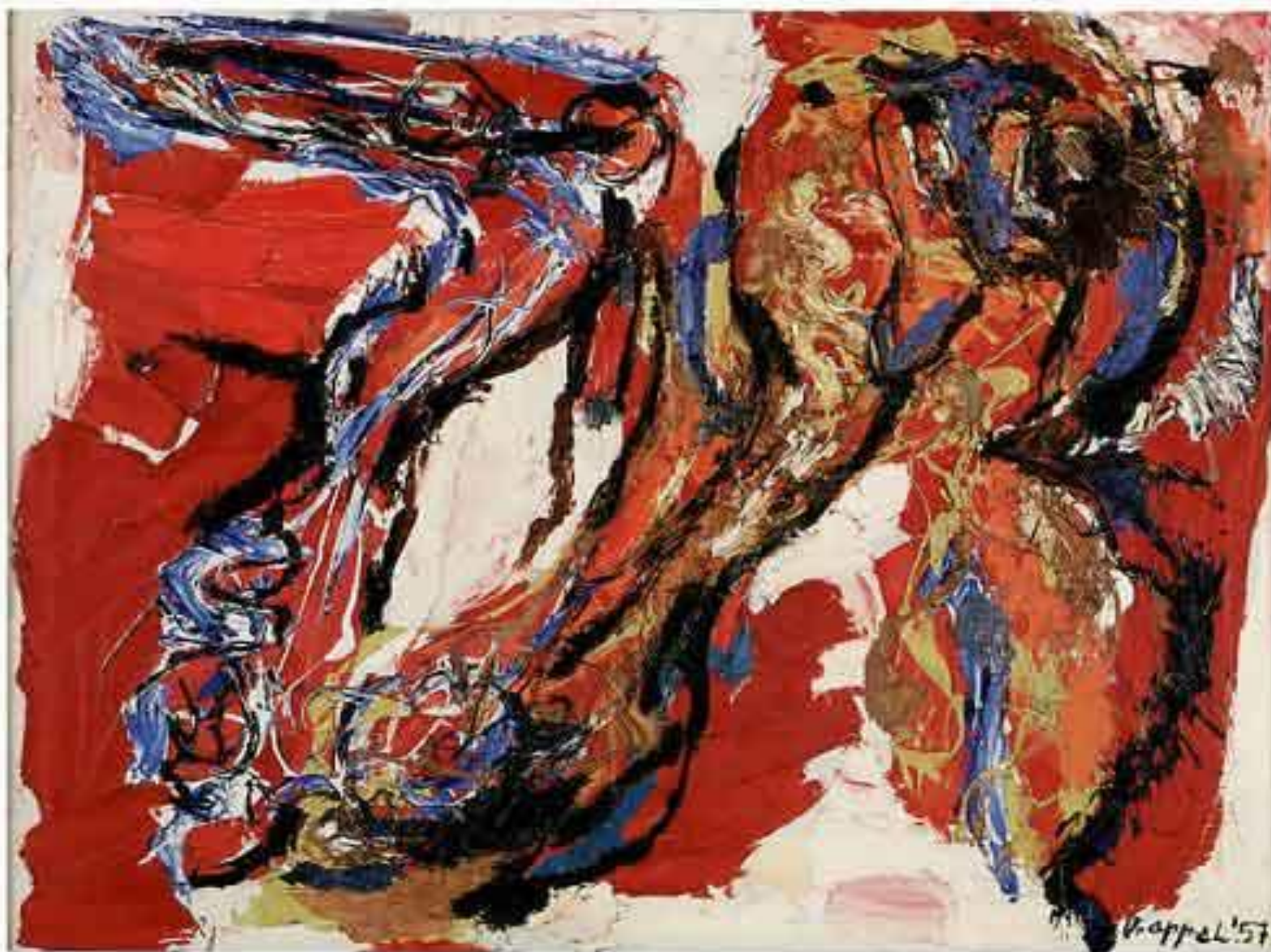
Аппель, Карел (1921—2006)