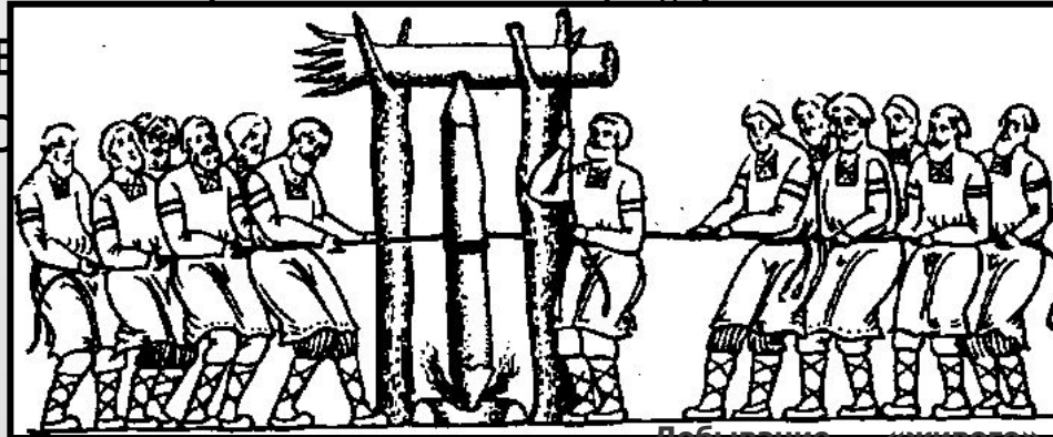
Добывание «живого» священного огня Реконструкция