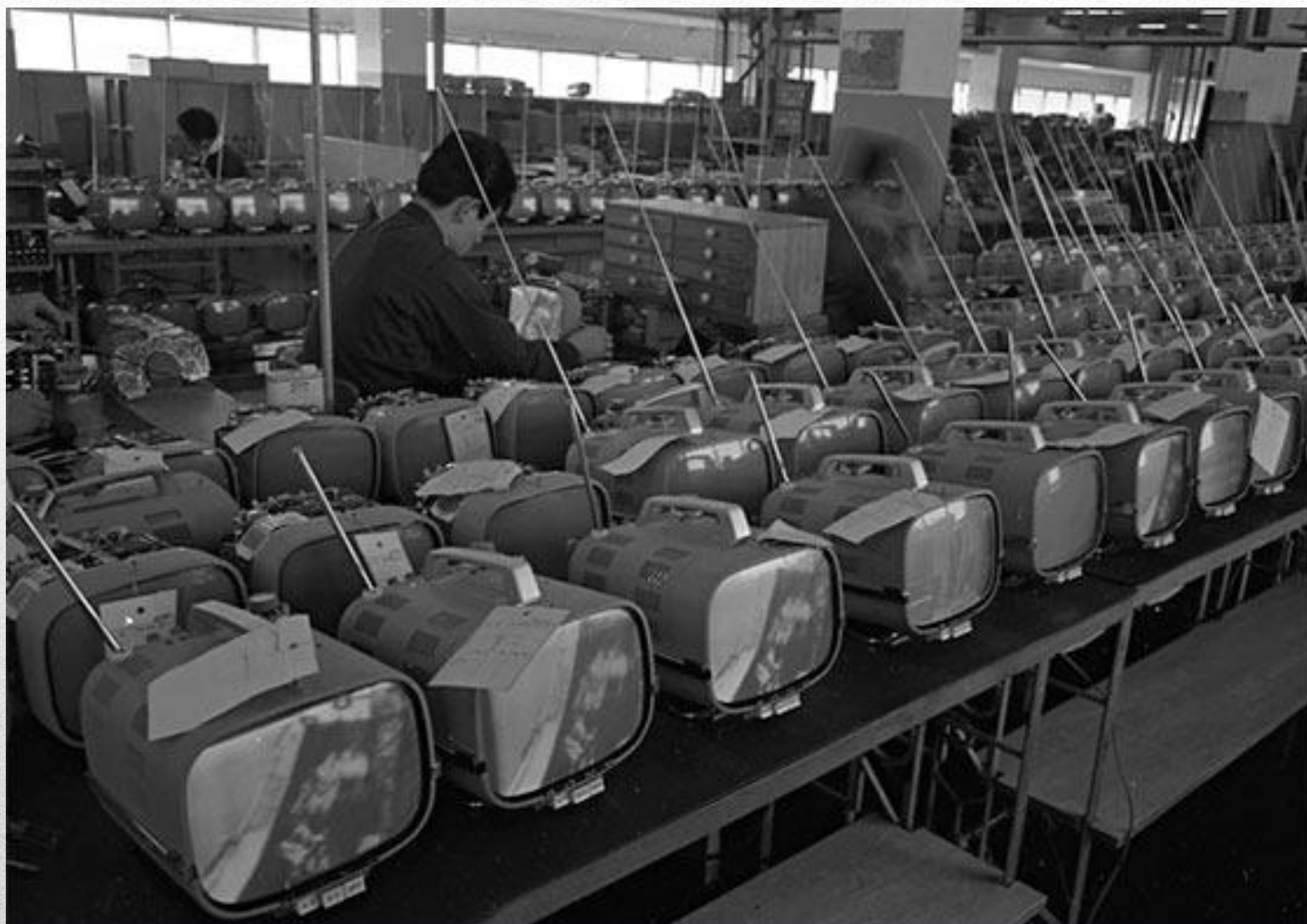
Цех по сборке портативных телевизоров