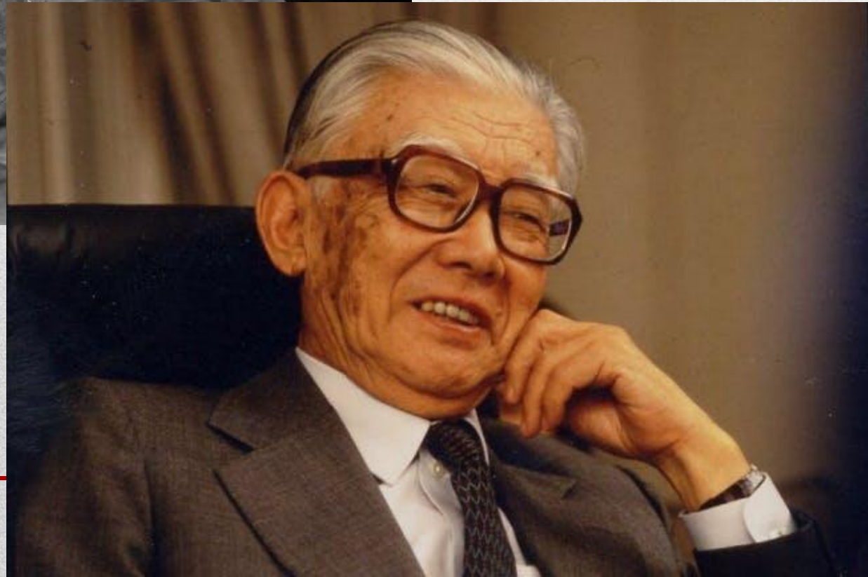
井深大 Ibika Masaru