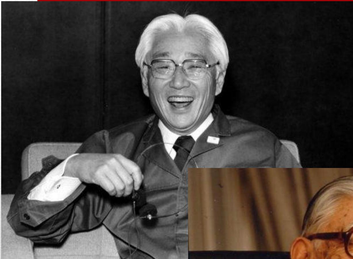
盛田昭夫 Morita Akio