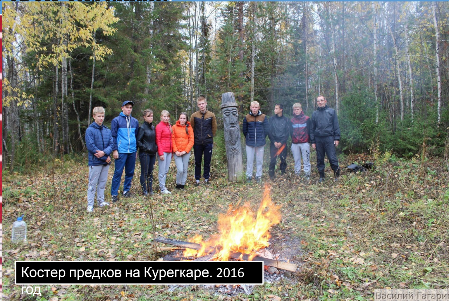
Костер предков на Курегкаре. 2016

Несколько десятилетий назад склоны горы Курегкара были голыми. Деревья там не росли. Бабушки из близлежащих деревень вспоминают, что вечерами на вершине мелькали какие-то огоньки. Они до сих пор верят, что это была чужья Сокровища свои охраняла.