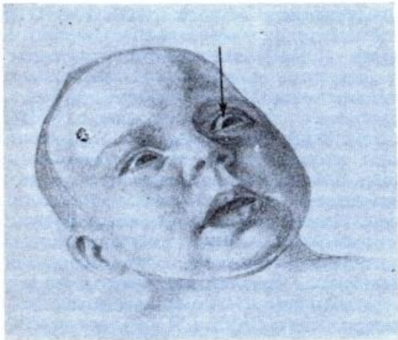
СИМПТОМ „ЗАХОДЯЩЕГО СОЛНЦА” при гемолитической болезни новорождённого.