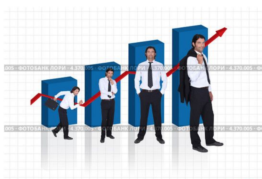
Бизнесмен в разных позах у графика роста