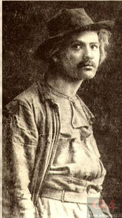
Сатин — Р. Валентин. Спектакль Kleines Theater, Берлин. Фото 1903