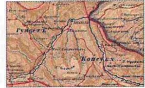
Центральный Дагестан (фрагмент карты 1847 года) Вольные общества Дагестана и Чечни - социальная и территориальная основа Северо-Кавказского имамата. Вслед за взятием русскими войсками резиденции Шамиля в Акулюго (1839) обнаруживается многочисленность таких потенциальных резиденций.