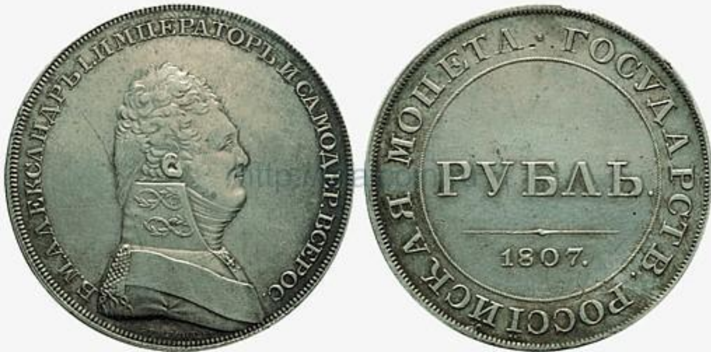
Рубль до реформ 1810 и 1812 года