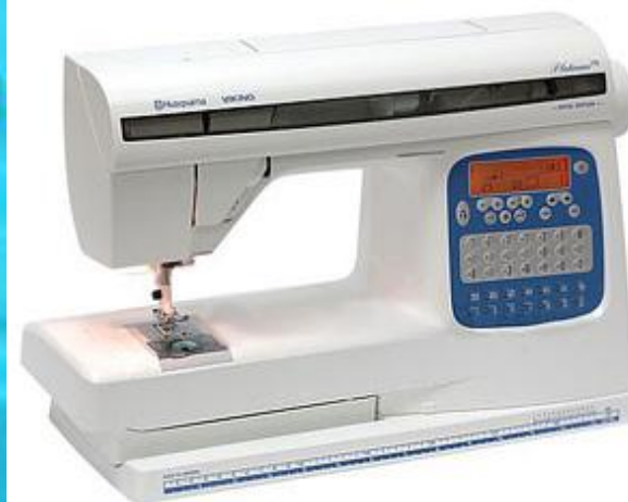
Швейная машина с электроприводом