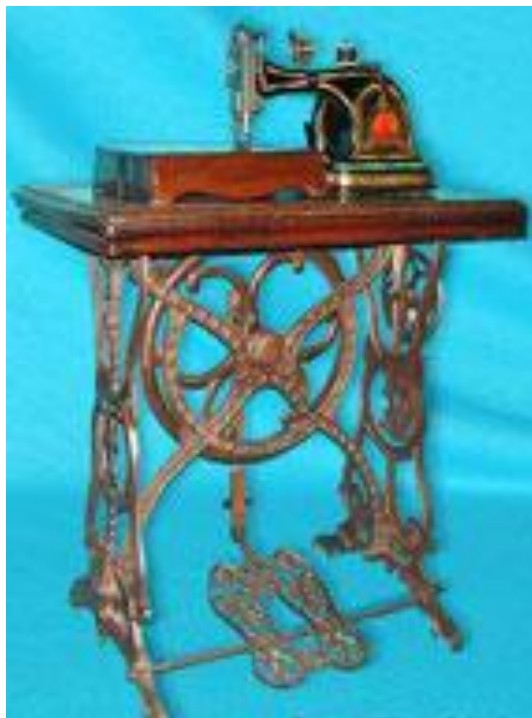
Швейная машина с ножным приводом